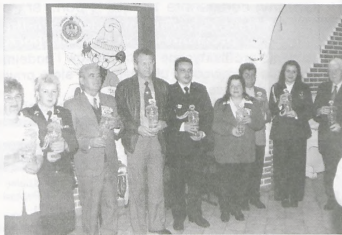
Laureaci konkursu w kat. kronik jednostek OSP