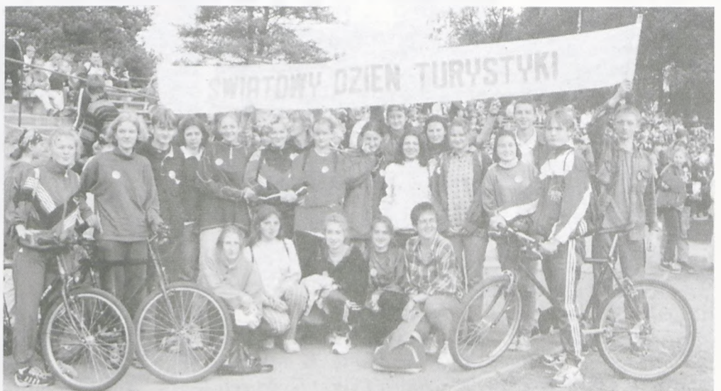
Grupa rowerzystów z wronieckiego technikum