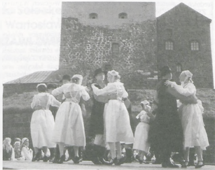
Zespół „Marynia” tańczy przed muzeum w Wyborgu.