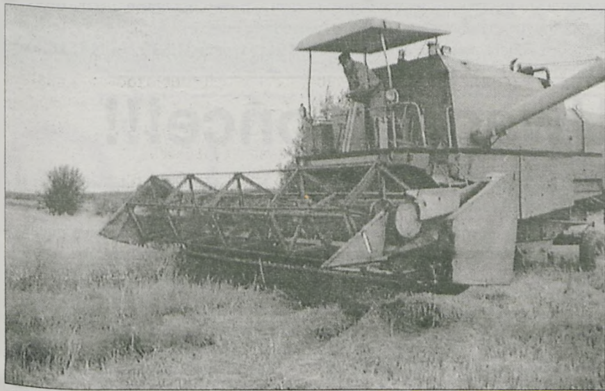
Żniwa przekroczyły już półmetek. Rolnicy przy ładnej pogodzie pracują do późnych godzin nocnych

Żeby zebrać plony i maksymalnie wykorzystać sprzyjającą pogodę, rolnicy pracują od rana do późnych godzin nocnych. Maksymalnie wykorzystują sprzęt, który w tym roku jest dobrze przygotowany do akcji żniwnej. Na polach gminy Kotlin pracuje 8 eskaerowskich kombajnów. - Zimą przeznaczaliśmy dość znaczne fundusze na remonty sprzętu. Maszyny są dobrze przygotowane - mogą jechać na okrągło. Brakuje jedynie fachowców do obsługi kombajnów. Do tej