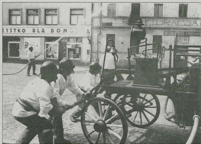
- Pali się!!! - te słowa rozpoczęły pokazy gaszenia ognia przy użyciu współczesnego i dawnego sprzętu