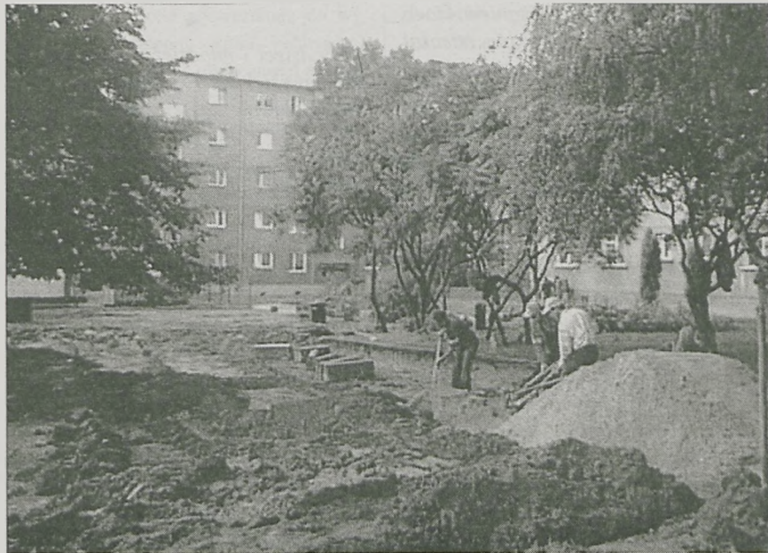
Mieszkańcy są zaskoczeni budową parkingu