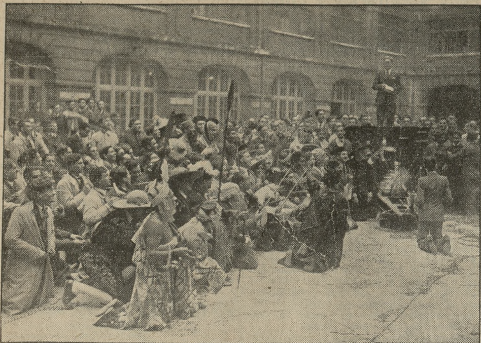
Niezwykle oryginalna scena tradycyjnego „chrztu” nowowstępujących do t. zw. Szkoły Centralnej w Paryżu. Różnokolorowi jej adepci w egzotycznych nieraz strojach słuchają z zainteresowaniem pełnego humoru przemówienia jednego z przywódców organizacyjnych.