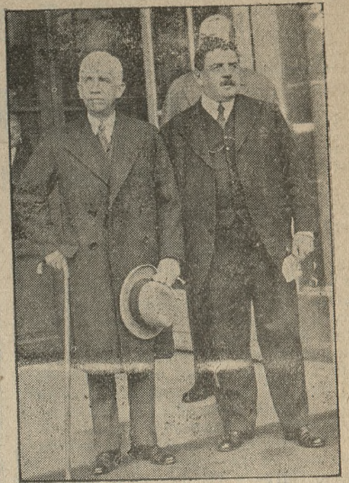
Ostatnio bawił przejazdem w Paryżu delegat amerykański na konferencję rozbrojeniową Norman Davis i odbył szereg narad z Herriotem. Na zdjęciu widzimy znakomitego męża stanu St. Zjedn. (po lewej stronie), obok premiera Francji.

(k) Wyniki Targów na jęczmień browarny. W niedzielę zakończyły się I Ogólnopolskie Targi na Jęczmień browarny. Wynik targów był pomyślny, gdyż zawarto na nich transakcyj na 32 wagony (ca 480 tonn) jęczmienia. Prócz tego złożono na Targach ze strony nabywców ofert na przeszło 80 wagonów (ca 1300 tonn) jęczmienia, którego próby były wystawione. Transakcje te nie mogły dojść do skutku w czasie targów, z powodu nieobecności ośnośnych wystawców. Wobec tego obecnie, już po zamknięciu Targów transakcje są w stadium zawierania. Jeżeliby transakcje, które po targach doszły względnie jeszcze dojdą do skutku, tylko na połowę wyżej wymienionej ilości jęczmienia, czyli ogółem dzięki