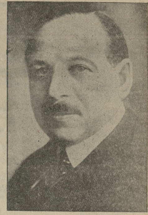
Emeryk Kalman, światowej sławy kompozytor operetek („Bajadera”, „Hrabina Marica”, „Manewry jesienne” itd.), w dniu 24 bm. kończy 50 rok życia. Wszystkie stacje radiowe Europy i Ameryki zapowiadają w programach dnia tego transmisje jego utworów.

Złoty puchar Schmelinga dla zwycięzcy meczu Polska — Niemcy. Korespondent P. A. T. donosi, że wbrew wiadomościom, które się ukazały w prasie, drużyny niemieckiej na mecz z Polską jeszcze nie ustalono. W reprezentacji napewno wezmą u-