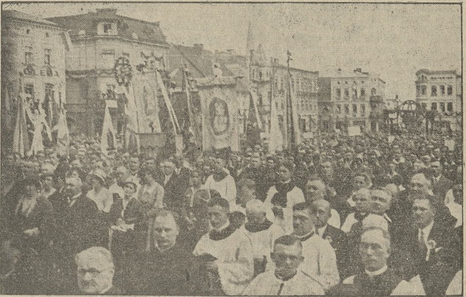
20 tysięcy wiernych zaległo Rynek i przyległe ulice, wysłuchując w skupieniu mszy pontyfikalnej celebrowanej przez Ks. Prymasa.

świnie wagi około 150 kg., które na miejscu ubili.