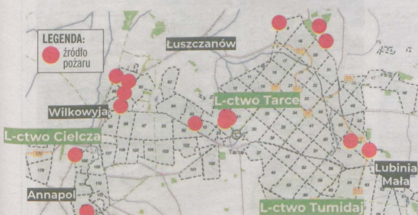
Mapa z lokalizacją pożarów w leśnictwach Cielcza i Tarce w latach 2022-2023 (15 przypadków, w tym 2 w tych samych miejscach)