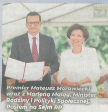
Premier Mateusz Morawiecki wraz z Marleną Małag, Minister Rodziny i Polityki Społecznej, Poseł na Sejm RP