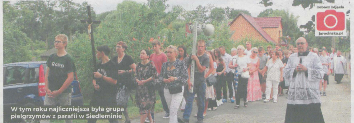
W tym roku najliczniejsza była grupa pielgrzymów z parafii w Siedleminie

społecznej, Marlena Małąg po raz pierwszy gościła w Golinie przy okazji odpustu połączonego z obchodami 50. rocznicy koronacji obrazu Matki Bożej Pocieszenia, który miał miejsce w sierpniu 2020 roku. Było to w trakcie pandemii koronawirusa. Wtedy nie zorganizowano grup pielgrzymkowych. Zabrakło też otoczki towarzyszącej odpustowi, czyli straganów. W zeszłym roku na zakończenie sumy zawierzyła polskie rodziny opiece Matki Bożej Pocieszenia. W tym roku wspominała, że ma szczególnie sentyment do Goliny