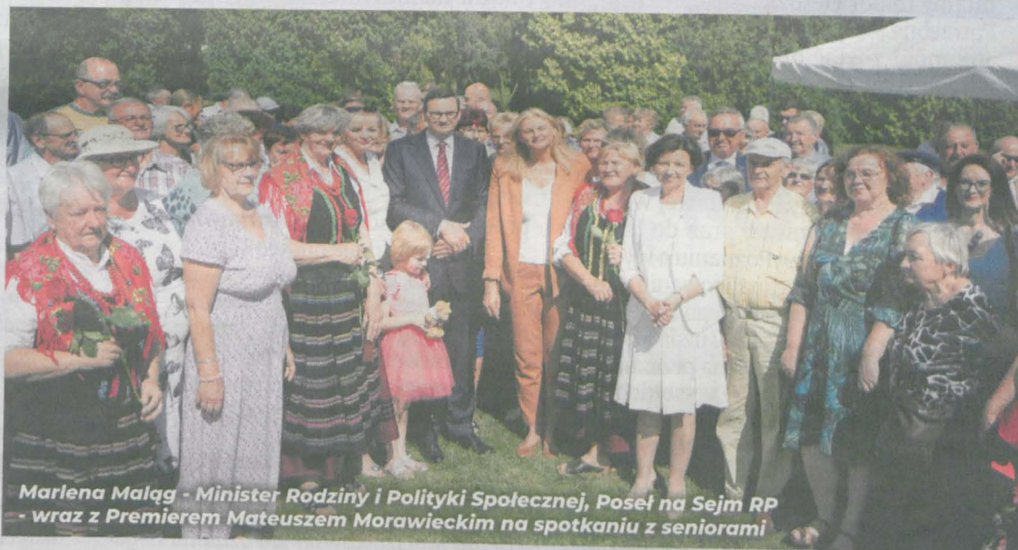
Marlena Małag - Minister Rodziny i Polityki Społecznej, Poseł na Sejm RP - wraz z Premierem Mateuszem Morawieckim na spotkaniu z seniorami

wniosku o czternastkę. Pieniądze będą wypłacane z urzędu, tak jak do tej pory w przypadku zarówno 13., jak i 14. emerytury - podkreśliła minister Marlena Małag.