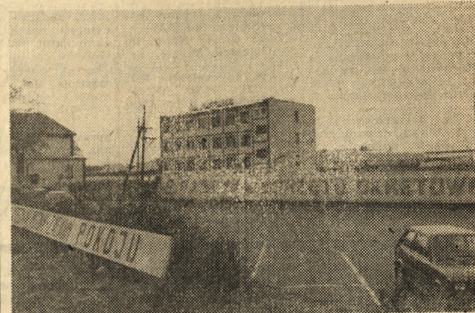
Wszelkiego rodzaju meble i sprzęt do wyposażenia statków i promów pasażerskich (głównie do kajut, kuchni, restauracji) wytwarza Fabryka Sprzętu Okrętowego „Meblor” w Czarnkowie (Piłskie). Zdobyła więc już sobie renomę w świecie.