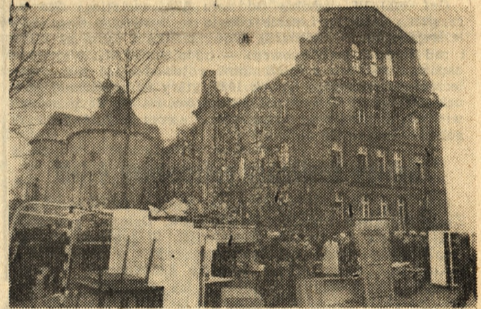
Ogień strawił prawie cały dach domu dziecka we Wronkach.