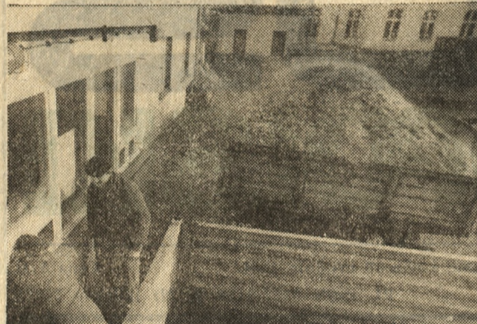
W cukrowni w Środzie (Poznańskie) podczas odbioru wyładków.