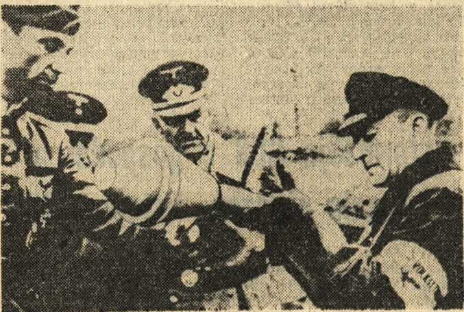
Podstawowym uzbrojeniem Volksturm były pancernice, do których obsługi szybko przyczynano cywilów — starsców i dzieci. Reprodukacja — R. Świątkowski

Nadesłane na konkurs prace oceni komisja, której skład oglosimy w terminie późniejszym. Przewidujemy przyznanie nagród i wyróżnień pieniężnych na łączną kwotę 60 tysięcy zł. Ponadto komisja konkursowa może zaproponować kuratorom oświaty i wychowania przyznanie nagród specjalnych dla autorów najlepszych prac w obrębie poszczególnych województw. W przypadku publikacji prace będą honorowane według obowiązujących stawek. Wyniki konkursu oglosimy do 30 maja 1985 roku.