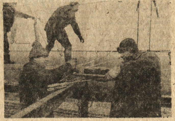
W Kluczborku dobiegają końca prace przy budowie obwodnicy kolejowej. Ominięcie stacji kolejowej w tym mieście wpłynie na poprawę regularności i skrócenie czasu przejazdu pociągów ze Śląska w kierunku Wrocławia i dalej do nadbałtyckich portów. Na zdjęciu: podczas rozpinania sieci trakcyjnej.