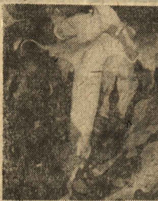
Datura czyli bielun dziedzierzawa odznacza się pięknymi kwiatami

W Poznaniu powierzchnia ogrodów działkowych ma wzrosnąć o 800 hektarów, z czego dotychczas władze wo-