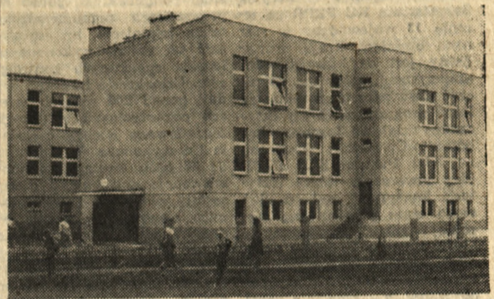
W Gorzynie (Leszczyńskie) kończy się budowę przedszkola.

W Leszczyńskim w różnych typach szkół uczy się około 70 000 dzieci i młodzieży. Powszechnym nauczaniem objęto całą młodzież, a 97 proc. absolwentów szkół podstawowych podejmuje naukę w szkołach średnich. Możliwości dalszego rozwoju oświaty zostały jednak w ostatnich latach przyhamowane, a istniejąca w regionie baza materialna oświaty z coraz większym trudem umożliwia prawidłową realizację zadań wychowawczo-dydaktycznych i opiekuńczych.