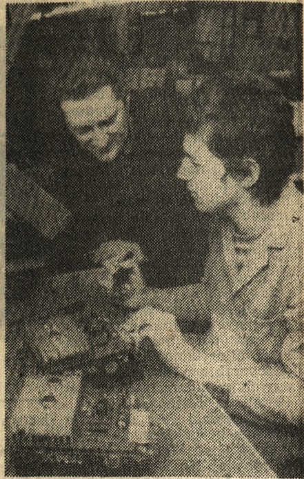
Uczniowie podczas zajęć politechnicznych z mikroelektroniki w zakładach w Zell-Mehlis.