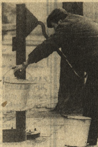
Ciągle w wielu zagrodach wodę zapewnia tradycyjna pompa. I z wiadrami wykonuje się codziennie sporo „rund”. Niekiedy zaś z pompy ledwo ciurka, bo studnia pustawa.

P otrzeb i poboru wody w gospodarstwie wiejskim nie liczy się liczbą czajników, których zawartość za gotowuje się na herbatę. Zużywa się bowiem — zwłaszcza przy rozwiniętej hodowli — setki albo i tysiące litrów. Obliczono, że przeciętna zagroda chłopska potrzebuje dziennie od 700 do 1000 litrów, czyli od 70 do 100 wiader (jedna tylko krowa ma w zwyczaju gaszenie pragnienia przynajmniej sześcioma), które trzeba nosić z podwórza. Jeśli — oczywiście — do gospodarstwa nie jest doprowadzony wodociąg.