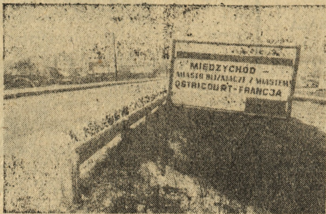
Kolorowa tablica przed rogatkami Międzychodu (Gorzowskie) głosi, że miasto jest bliźniacze z miastem Ostricourt we Francji.