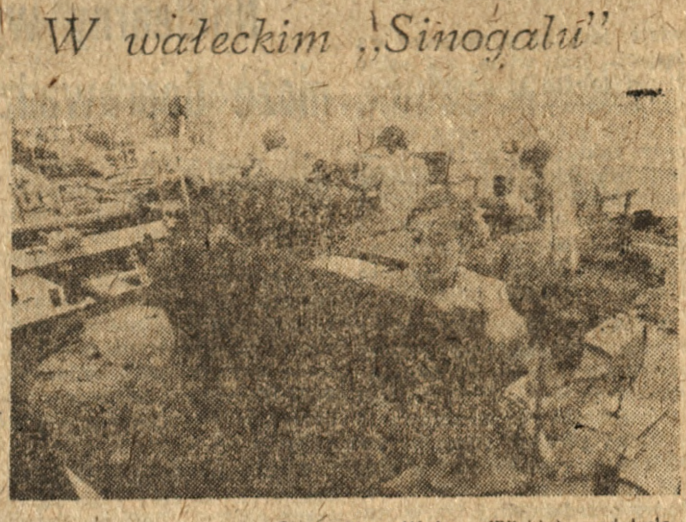
Spółdzielnia Inwalidów „Sinogal” w Wotcu (Piłskie) produkuje m.in. torby, nesery, galanterię i odzież roboczą. Na zdjęciu: fragment szwalni w której szyla sa kombinezony robocze.