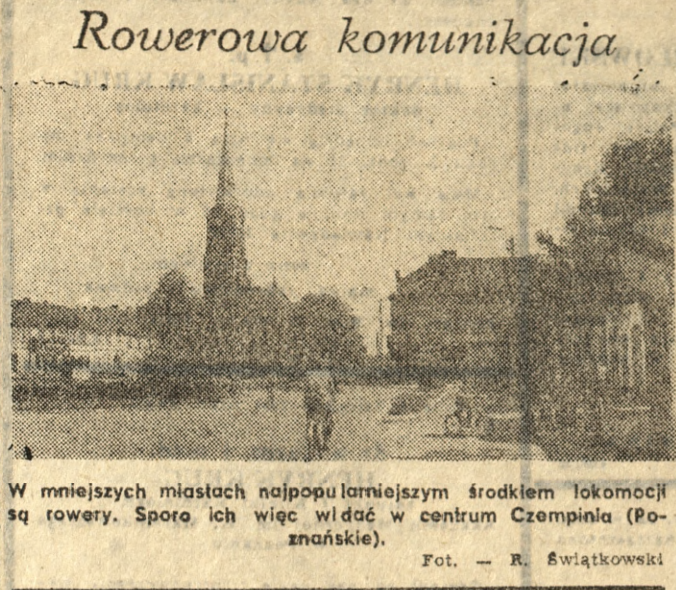
W mniejszych miastach najpopularniejszym środkiem lokomocji są rowery. Sporo ich więc widać w centrum Czempina (Poznańskie).

Na pewno jednak dojeżdżającym do pracy czy szkoły w sumie nie ma czego zazdrościć. Tracą przecież sporo czasu w codziennych podróżach i to męczących (akurat te mniej kształca, choć podróż — jak się ma wia — kształca). Zwłaszcza teraz — podczas jesiennej pluchy i zbliżającej się zimy. (bop)