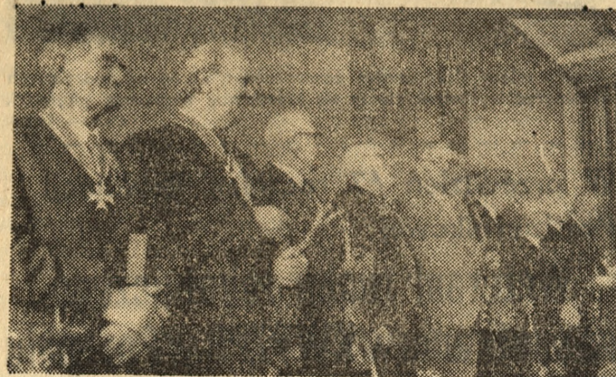
Grupa weteranów ruchu robotniczego wyróżnionych odznaczeniami państwowymi na wczorajszym spotkaniu w KW PZPR w Poznaniu.

Dzisiejszy serwis informacyjny opracował Walerian Ignosiek