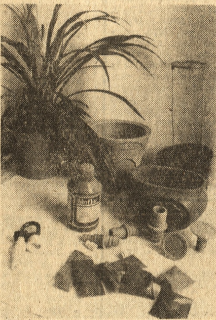
Oto mały fragment ekspozycji OSWU. Najlepiej jest z nawozami i doniczkami, ale na łopaty i widły producentów jak nie ma tak nie ma.

motyczki i pazurki do spulchniania gleby, zrywacze owoców, różnego rodzaju rękawice ochronne, bardzo poszukiwana maść ogrodnicza, nawozy organiczne i mineralne w rozmaitych opakowaniach: w ilości przeznaczonych na kilkadziesiąt metrów kwadratowych po-