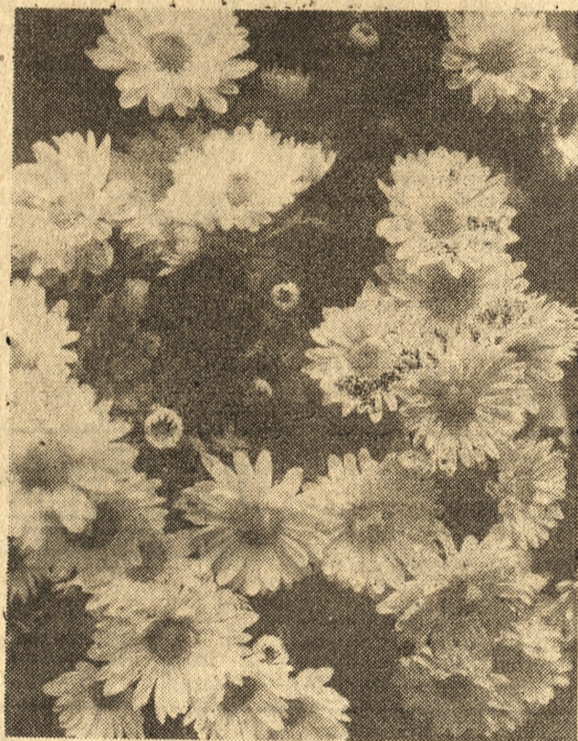
Kwitną jeszcze ostatnie kwiaty: marcinki i złocenie, zwane chryzantemami. Te ostatnie są szczególnie piękne, tworząc bukiety o kolorach od białego poprzez żółty, lila do rudoczerwonego. Odmiany hodowane w ogródkach to byliny wytrzymale na mróz i znajdujące coraz częściej zastosowanie na rabatach kwiatowych. Wielu ludzi przystroi nim groby swoich bliskich.