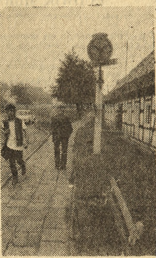
Zniszczona ławka na przystanku PKS we Włoszakowicach (Leszczyńskie) denerwuje mieszkańców i czasowiczków oczekujących tutaj na autobusy.