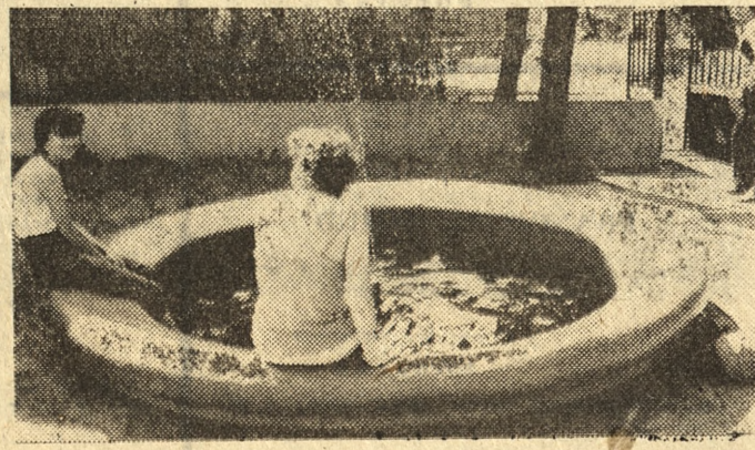
Fot. (2) „Głos” — R. Królik