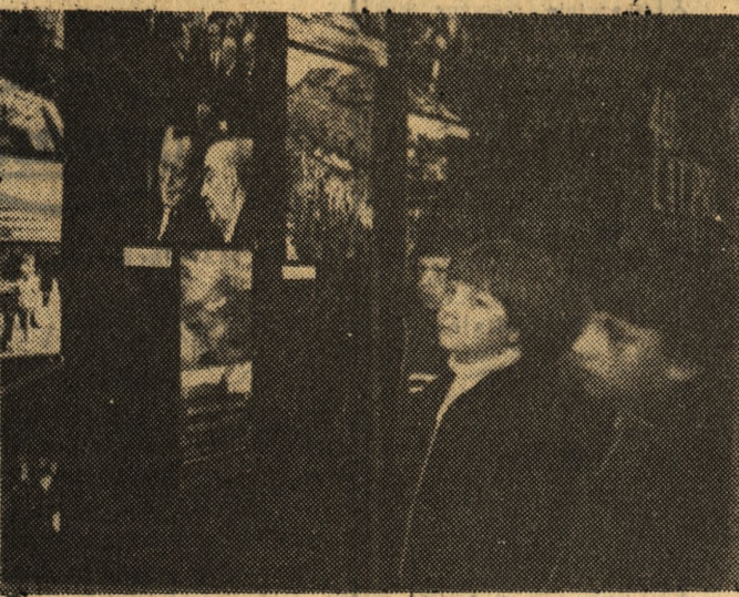
Fragment ekspozycji w Pile.

W salonach Biura Wystaw Artystycznych w Pile czynna jest do 12 sierpnia wystawa „40 lat Polskiej Ludowej w fotografii prasowej”. 120 fotogramów ukazuje powojenną historię kraju. Niektóre zdjęcia wykonane przez Centralną Agencję Fotograficzną znane są z tamów