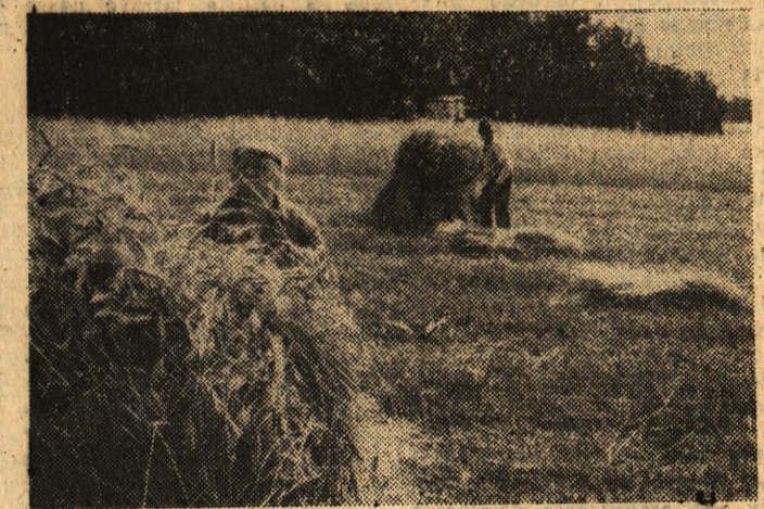
Pogoda ciągle kaprysi, trzeba się więc spieszyć, by zboża jak najprędzej zniknęły z pól. Praca jest tym trudniejsza, że wiele jest wylegniętego.

Na zdjęciu: duże zniwa we wsi Wilkowyja (Kaliskie).