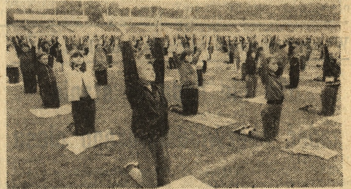
Ponad 1300 dziewcząt i chłopców z poznańskich szkół przygotowuje wspaniały pokaz gimnastyczny, który uświetni uroczyste otwarcie XI Ogólnopolskiej Spartakiady Młodzieży w Poznaniu. Na zdjęciu: podczas próby na stadionie GKS Olimpia.

Posiedzenie inauguracyjne Głównej Komisji Badania Zbrodni Hitlerowskich w Polsce — Instytutu Pamięci Narodowej