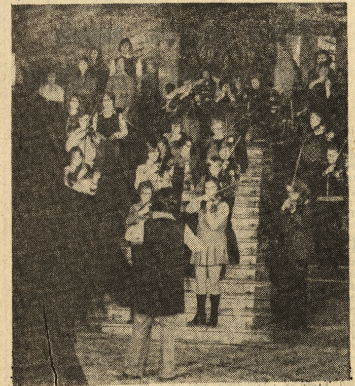
Zgorzelec współcześnie — w kulturze ewenementem jest wspólna 50-osobowa orkiestra symfoniczna.

Opodal centrum, wzdłuż Nysy Łużyckiej rozciąga się park im. Karola Świerczewskiego. O drogę do Miejskiego Domu Kultury nie trzeba pytać, okazały budynek widoczny jest z daleka, zwłaszcza zaś górująca nad zielenią kopia. Stając przed tym budynkiem nie sposób nie powrócić do pierwszych lipcowych dni roku 1950. Dni znaczących tak wiele, nie tylko dla Polski i NRD, ale również Europy.