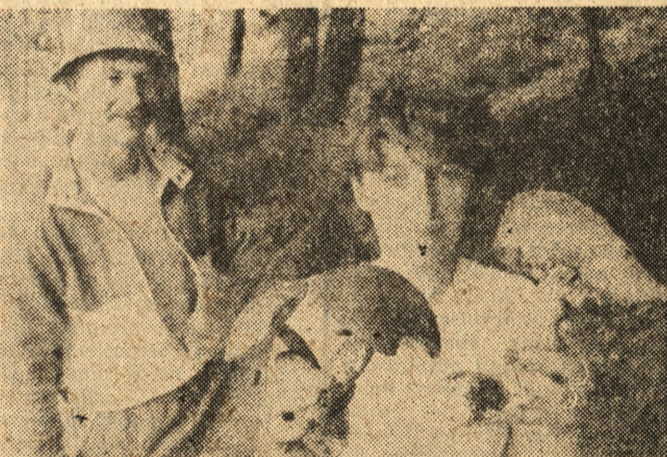
W pilskich lasach pojawiły się grzyby. Na zdjęciu: wczasowicze z ośrodka wypoczynkowego „Płotki” koło Pily po grzybobraniu.