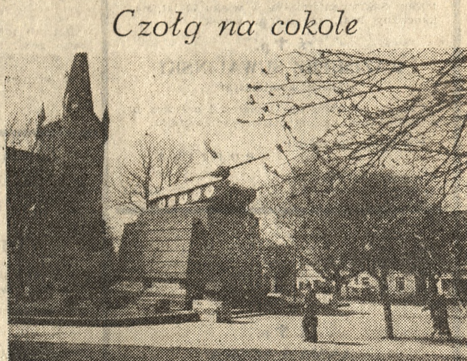
Na placu Wolności w Czarnkowie (Pilskie) stoi oryginalny pomnik ku czci poległych żołnierzy radzieckich.