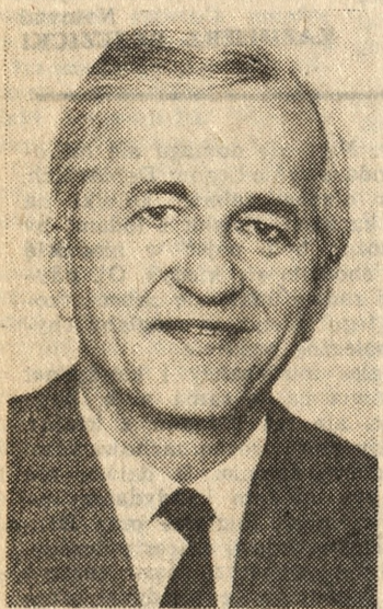
Richard von Weizsäcker

Od zeszłej środy Republika Federalna Niemiec ma nowego prezydenta. Na kolejną kadencję (od 1 lipca br.) będzie nim Richard von Weizsäcker, członek Unii Chrześcijańsko-Demokratycznej, do niedawna nadburmistrz Berlina Zachodniego.