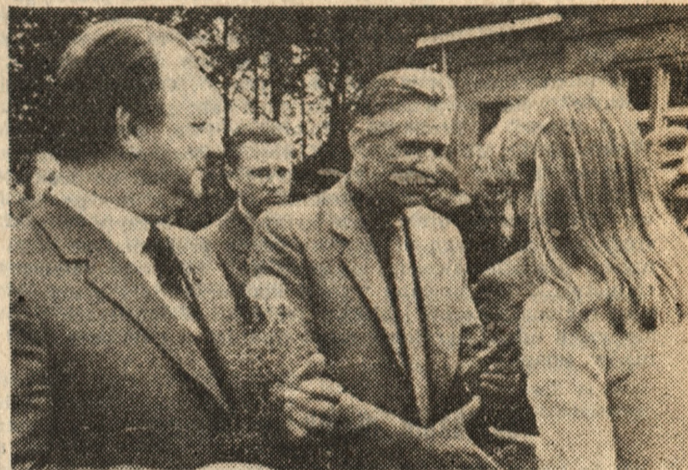
Młodzież szamotulska serdecznie powitała gości.