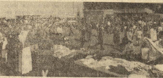
Atrakcyjny był sobotni festyn sportowo-rekreacyjny zorganizowany w Szamotułach (Poznańskie). Towarzyszył mu kiermasz handlowy.