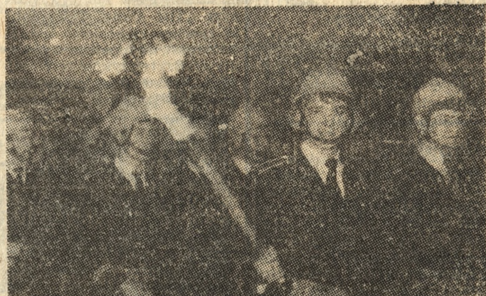
W sobotni wieczór ulicami Poznania przemarszerował strażacki capstrzyk.