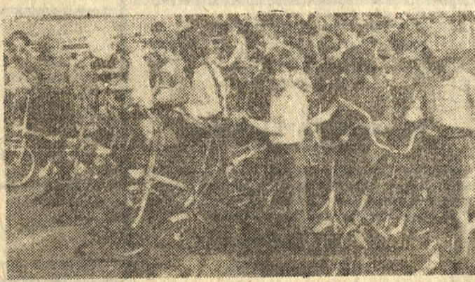
Dużym zainteresowaniem cieszyły się wyścigi dzieci na rowerkach.

Zaraz też przystąpiono do rozgrywania pierwszych konkurencji. Zawody w strzelaniu i kręglarstwie oraz turniej tenisowy cieszyły się dużym zainteresowaniem. Wielu zwolenników miały także rowerowe wyścigi dla dzieci. Ci, którzy