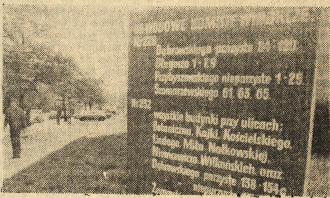
Oto przykład, jak można i należy informować o lokalach obwodowych komisji wyborczych i ich zasięgu terytorialnym. Na tablicę taką trafił nasz fotoreporter na ulicy Dąbrowskiej w Poznaniu.

Sprawdzenie spisu wyborców trwać będzie w województwach: poznańskim i piłskim do 22 maja włącznie, w województwie kaliskim do 21 maja włącznie, zaś w województwach: konińskim i leszczyńskim do 20 maja włącznie. (lad)