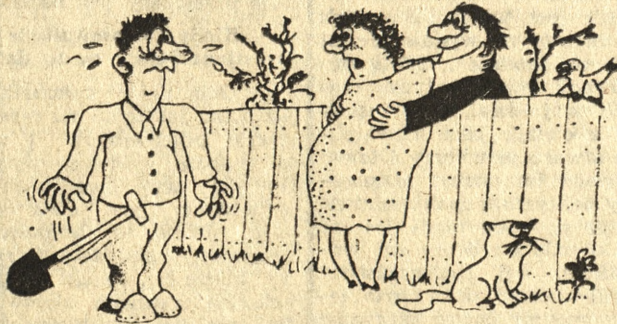
— Sam mówiłeś na zebraniu działkowców, że każdy może lak spędzać wolny czas, jak mu to odpowiada... Rys. — „Garten und Kleintierzucht”

Choroby występujące na jabłoniach i gruszach to parch i mączniak. Gałązki porażone przez mączniaka (mączysty nalot) najlepiej wycinać sekatorami i palić. Ze szkodników mogą wystąpić owocnice (jabłonie, grusze, śliwki) pod koniec kwitnienia, a pod koniec maja owocówka jabłowieczka i śliwkowieczka. Również gąsienice zjadające liście oraz mszyce i przędziorki wymagają zwalczania chemicznego.