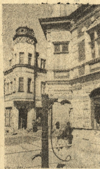
Uroczy zakątek udało się „uchwyć” fotoreporterowi w śródmieściu Czarnkowa (Piłskie)