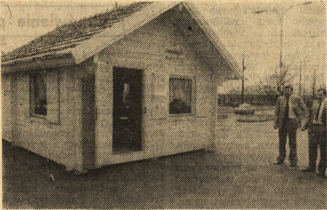
Wielkopolskie Fabryki Mebli całkowicie wyposażyły w sprzęt domek letniskowy z drewna zaprezentowany przez poznańską firmę „Interkulpol”, a ustawiony w pobliżu pawilonu 5 MTP.

Tymczasem, jak się okazuje, właśnie meblarstwo jest to jedna z nielicznych dziedzin produkcji, w których udało się powrócić do rozmia rów wytwórczości osiągniętych przed kryzysem, a nawet je przekroczyć. W roku minionym fabryki podległe Zrzeszeniu Producentów Mebli i Przedsiębiorstw Współpracujących mającej siedzibę w Poznaniu osiągnęły ilościowy poziom produkcji z roku 1980, a nawet o kilka procent go przekroczyły. Odbiorcy krajowi otrzymali również więcej mebli dlatego, że ostatnio zmalała ich eksport i obecnie wynosi on mniej więcej jedną dziesiątą całej produkcji. Do krajowych sklepów trafiło również więcej mebli dlatego, że fabryki częściowo przestawiły się z wytwarzania materiału i pracochłonnych mebli prestiżowych i luksusowych, a podjęły na nową skalę wytwarzanie sprzętów prostszych, pierwszej potrzeby. Pozwala to z tej samej ilości surowca wytworzyć więcej mebli. Można powiedzieć, że sytuacja zaopatrzeniowa, jest w kraju poprawna,