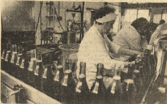
W Zakładzie Przelwórstwa Owocowo-Warzywnego w Koninie rozpoczęto rozlewanie nowego gatunku wina. Jest oparte na nowej recepturze, produkowane z własnych szlachetnych moszczów. Pierwsza dostawa wina „Konińskiego” trafi na świąteczne stoły. Na zdjęciu: linia napełniania butelek.