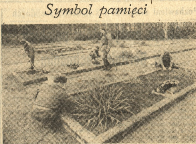
Cmentarzami żołnierzy, którzy wyzwolali Ziemię Nowotomską opiekują się młodzież szkolna i żołnierze okolicznych jednostek. Na zdjęciu: porządkowanie mogił na cmentarzu niedaleko Nowego Tomysła (Poznańskie).

Niemal wśród nas takich, co to kiedyś uważali za przyczynę rozmaitych zahamowań — centralizację. Ona stanowiła — tak dowodzili — istotną przyczynę mankamentów funkcjonowania różnych dziedzin