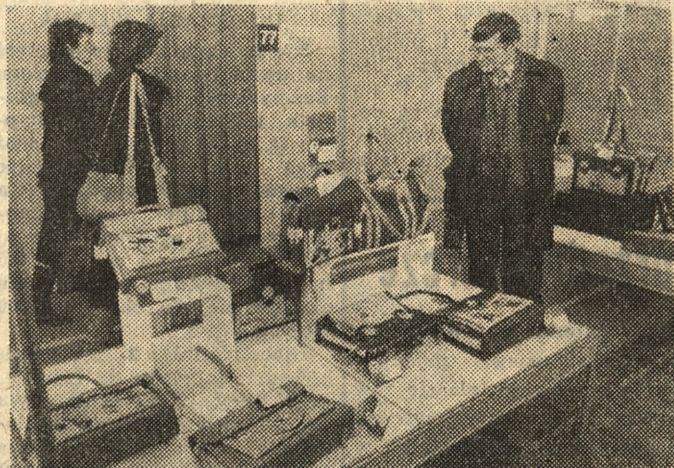
Stoisko Spółdzielni Inwalidów „Pokój” z Kalisza.