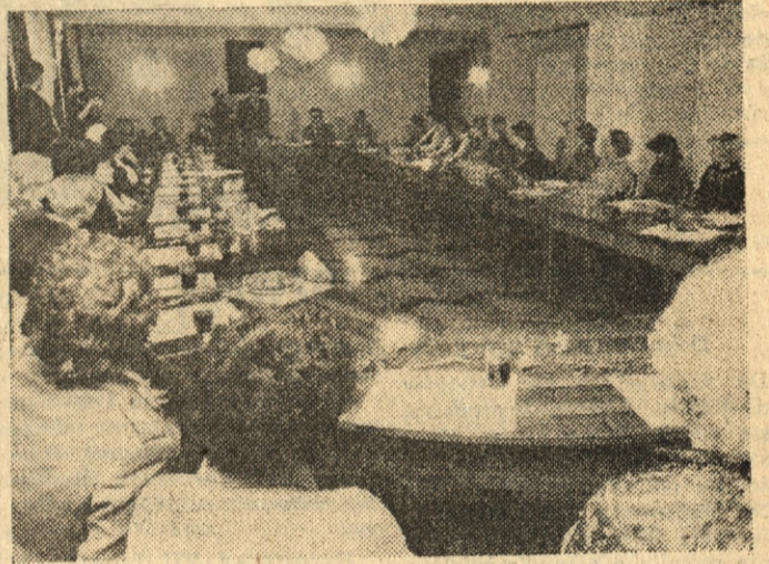
W czasie spotkania z okazji Międzynarodowego Dnia Kobiet.