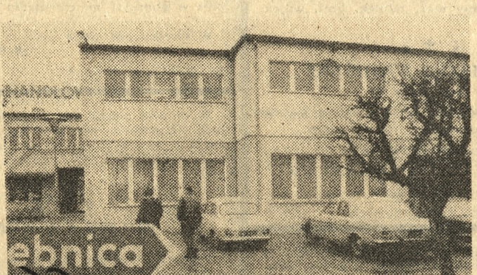
W Jutrosinie (Leszczyńskie) młodzież i dorośli mogą wolny czas spędzać w Miejsko-Gminnym Ośrodku Kultury. Od nich też zależy frekwencja i wyniki w kotach zainteresowań.