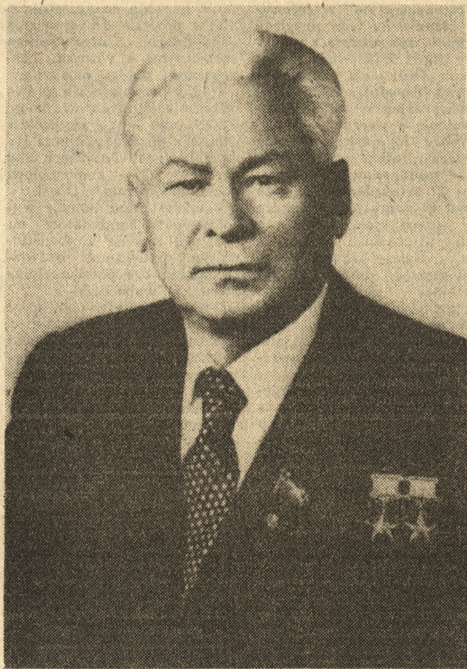
Życiorys K. Czernienki

(PAP) Konstantin Czernienko urodził się 24 września 1911 r. w wsi Bolszaja Ties w rejonie nowosielewskim w Kraju Krasnojarskim. Jest Rosjaninem. Od 1931 r. jest członkiem KPZR.