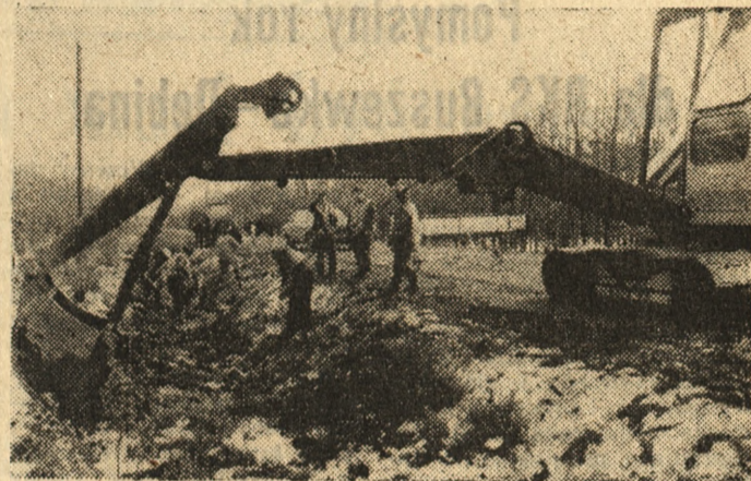
Brygady Rejonu Dróg Publicznych z Ostrowa (Kaliskie) wykorzystują dobrą pogodę do robót ziemnych i oczyszczają przydrożne rowy odwadniające. Na zdjęciu: jedna z trzech ekip pracuje w okolicy wsi Łękokociny.