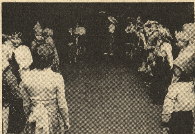
W krotoszyńskim Ośrodku Kultury obok regularnie działających klubów i kół zainteresowań czynna jest galeria sztuki, a w dużej sali widowiskowej organizowane są okolicznościowe imprezy. Na zdjęciu: bal przebierańców — jedna z imprez dla dzieci wycieczających podczas ferii w tym mieście kaliskiego.