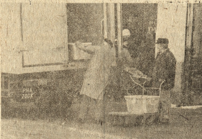
Co dzień, do każdego sklepu, setki i tysiące kilogramów. Wszystko to trzeba przenieść własnoręcznie.

wyższe dodatki, 400 złotych z tych dodatków zwolniono z opłat na PFAZ (to jedyna pozytywna decyzja ministra finansów na setki podobnych wniosków). Mówicie, że tak mało zarabiacie. Według moich danych kierowcy WPHW — o których najbardziej się tu upominacie — zarabiają do 18 000 zł miesięcznie, oczywiście z nadgodzinami i dodatkami za przeladunki. „Piekarze”, którzy rozwija pieczywo, zarabiają więcej niż „mleczarze” — a większość tych ostatnich pracuje tylko w nocy.