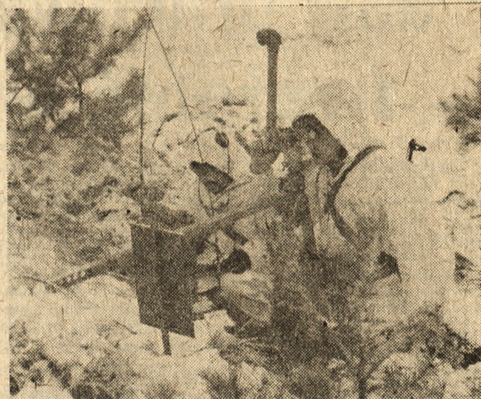
Zwiadowcy na posterunku obserwacyjnym.

Meldunek ten trafia do żołnierza zajmującego również od powiedzialne w baterii stanowisko rachmistrza. Błyskawicznie ściąga grube, zimowe rękawice i zabiera się do obli-