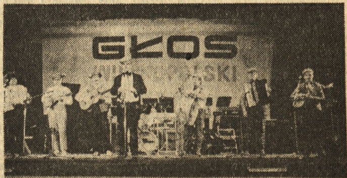
Poznański folklor zaprezentowała w „Arenie” kapela „Zza Winkla”

„Społem” oraz „Dom Książki” i Salon Wydawniczy KAW przy ul. Świerczewskiego. Największym powodzeniem cieszyły się najnowsze płyty zespołów „Lady Punk” i Krzak” oraz „Mandala życia” i ilustrowane bajki dla dzieci. Będą to zapewne miłe pamiątki uczestnictwa w naszym spotkaniu.