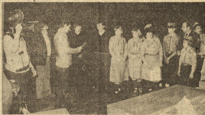
Wypowiedzi laureatów głosowego konkursu przedstawił poznański „Teleskop”.

wykonaniu między innymi piosenki o pszczołce Mai.