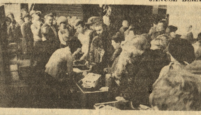
Wśród restauracji najlepsze oceny uzyskali: „Stary Koń” w Brzeźnie, przed „Zajazdem Poczтовым”. Najlepszy bar „Brzezina” również znajduje się w Brzeźnie.

Drugie miejsce zajęli „Karlík” w Gosławicach, trzecie „Hortex”, a czwarte „Fregata” (obydwa zakłady w Koninie). Wszystkie nagrodzone bary należą do „GS” Konin. (les).