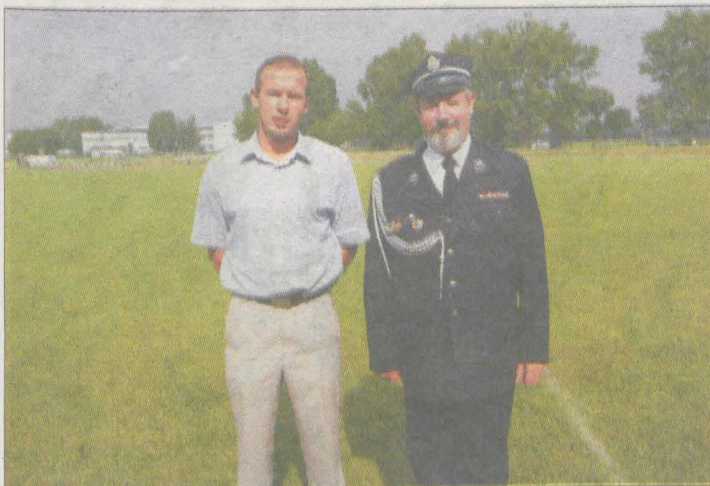
Nowe Miasto, Krzykosy