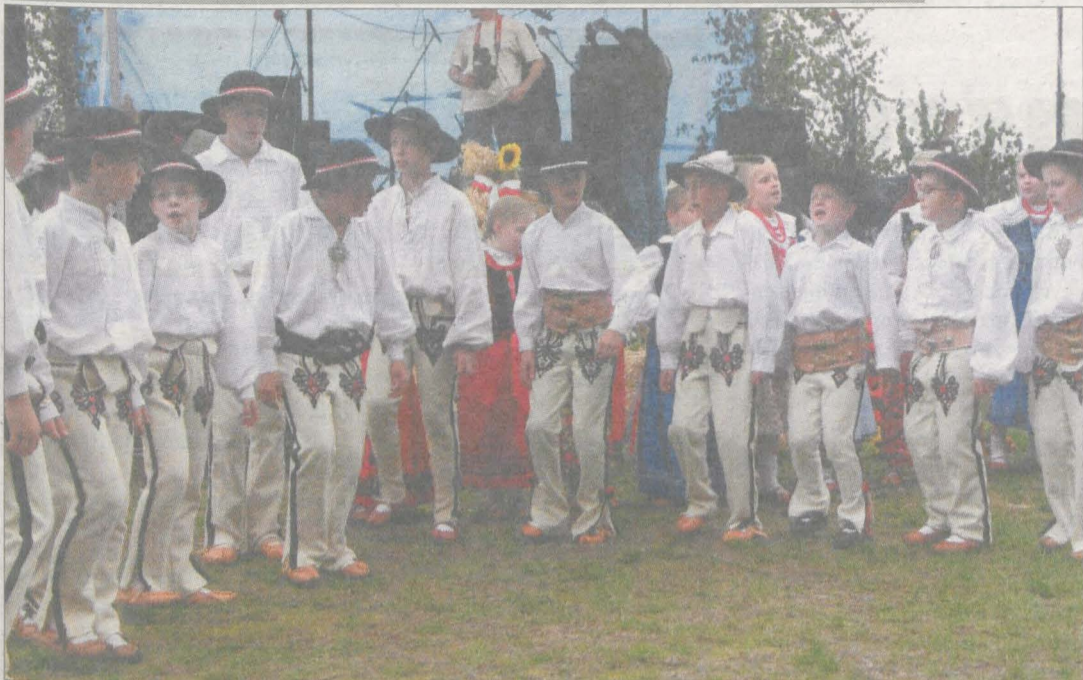
Publiczności bardzo podobał się występ bardzo młodych górali z zespołu Majeranki.

Dominowo, gminno - powiatowe święto plonów