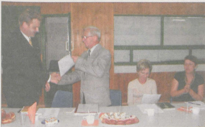
Zespół Szkół Zawodowych