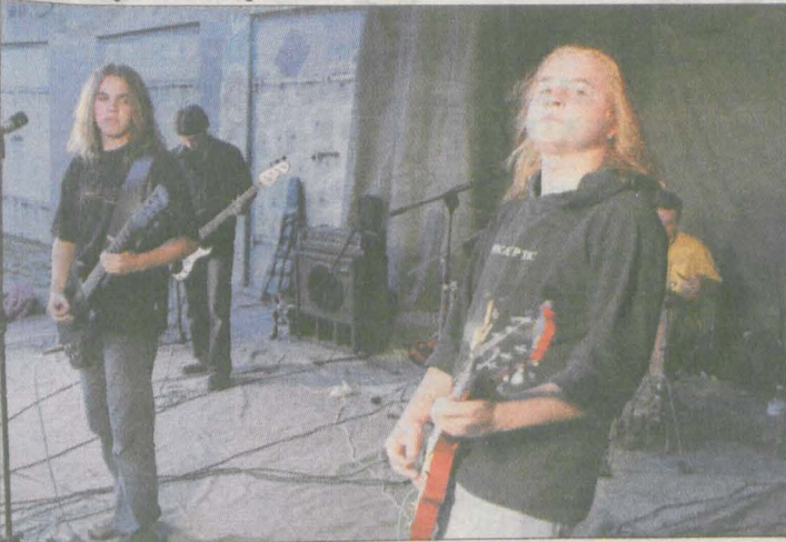
Zespół Furius zaprezentował cięższą odmianę rocka.

Cztery kapele ze Środy zaprezentowały swoje umiejętności podczas sobotniego koncertu w STRUS-ii, na terenie Powiatowej Kolei Wąskotorowej.