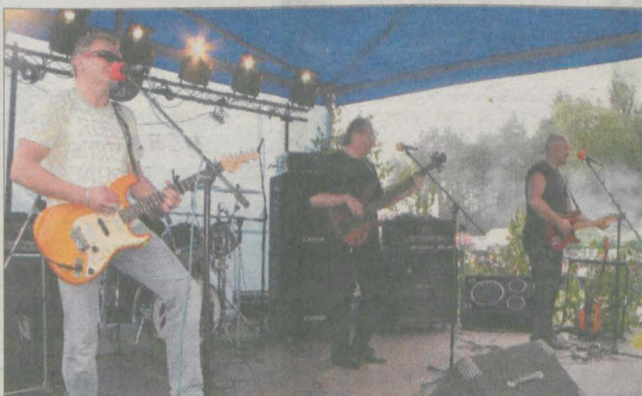
Żuki z Bydgoszczy rozkołysały publiczność.