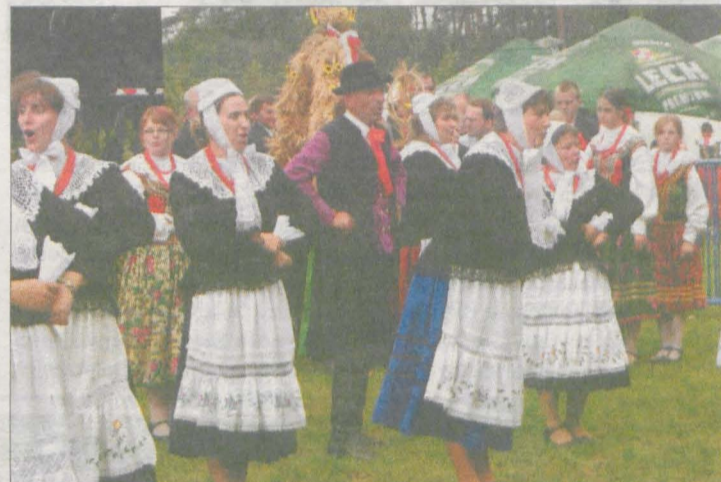
Obrzęd dożynkowy prowadził zespół Ziemia Wrzesińska.