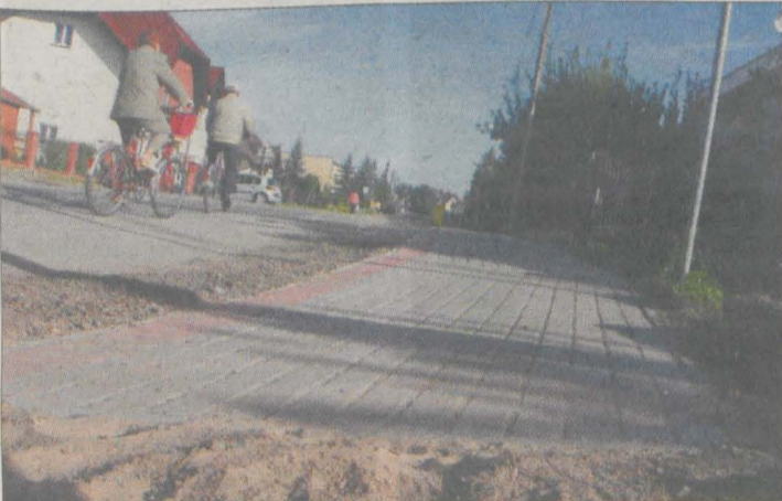
Na ulicy Chudoby powstał nowy chodnik.

Niespełna 160 tys. zł będą kosztowały w najbliższym czasie remonty chodników w Środzie. Prace wykonuje firma Trans - Masz.