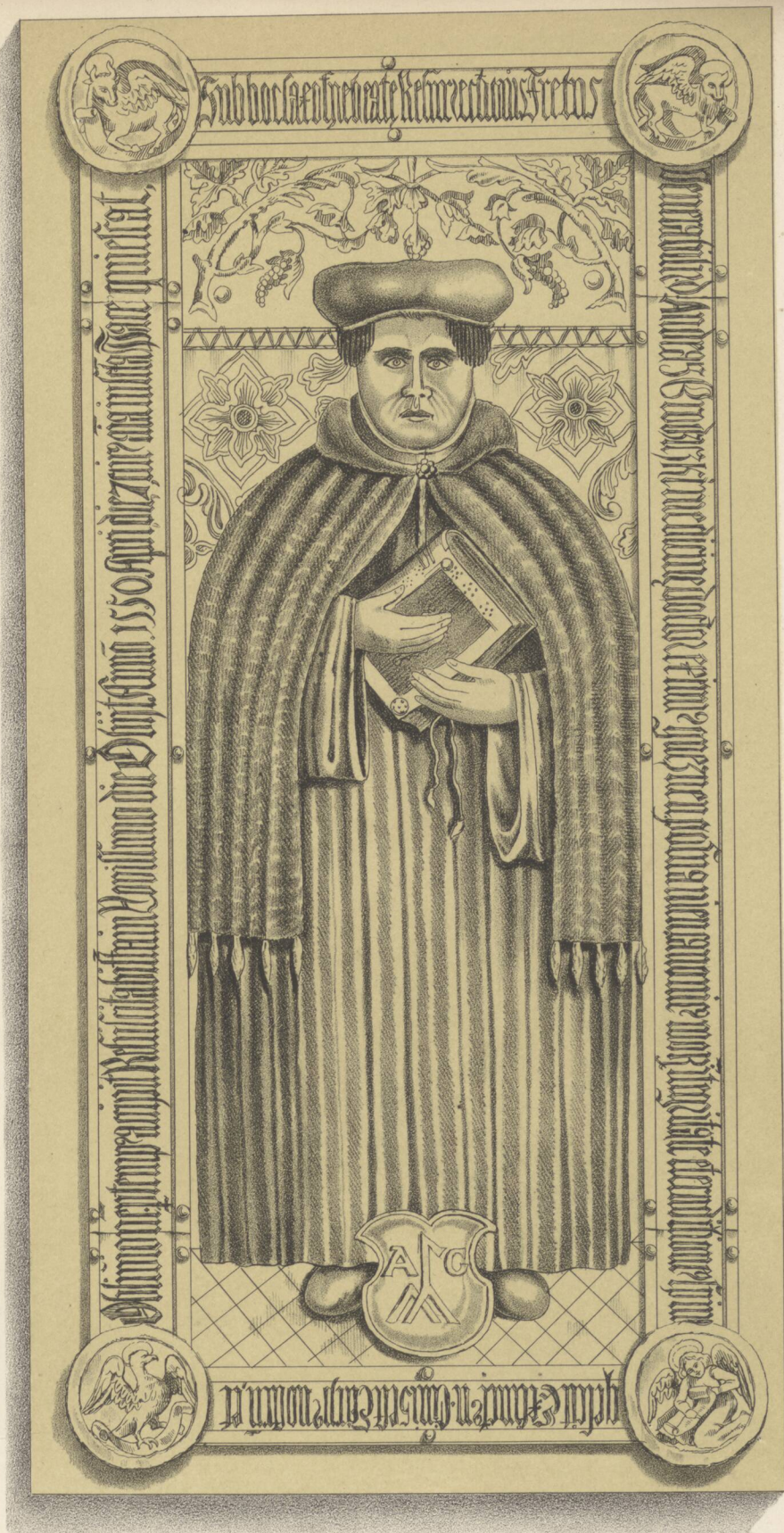
rys: X. St. Lekszycki.