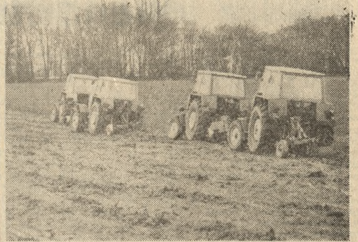
Pogoda sprzyja pracy na polach Wielkopolski. Wielu rolników rozsiewa nawozy, rozrzuca obornik, prowadzi orki. Na zdjęciu: pracującą brygadę traktorzystów na polach Stajdny Koni w Iwnie (Poznańskie).