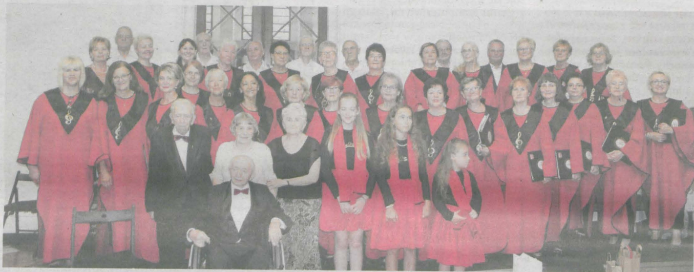
Przez 130 lat chór miał 21 dyrygentów i 24 prezesów. Obecnie zrzesza 45 osób