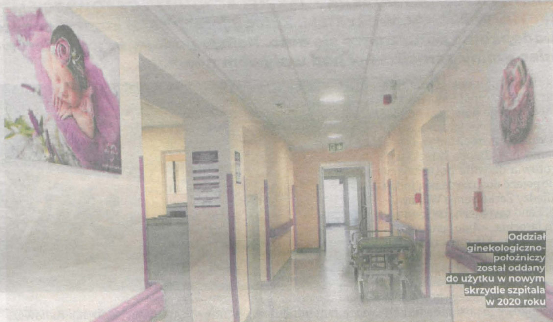
Oddział ginekologiczno-położniczy został oddany do użytku w nowym skrzydle szpitala w 2020 roku