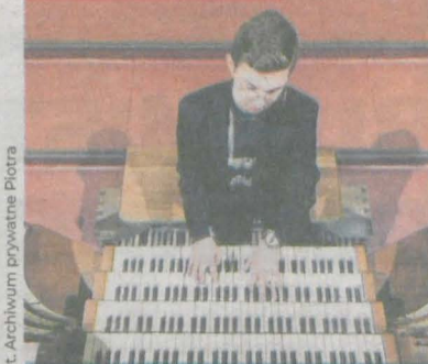
fol. Archiwum prywatne Piotra