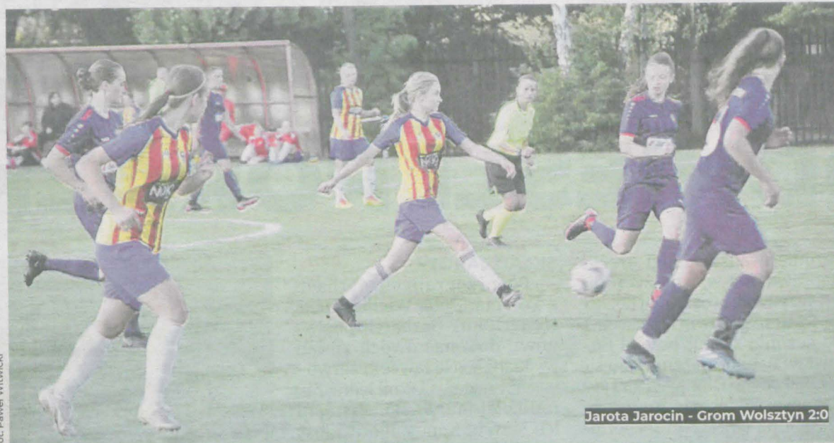
Jarota Jarocin - Grom Wolsztyn 2:0