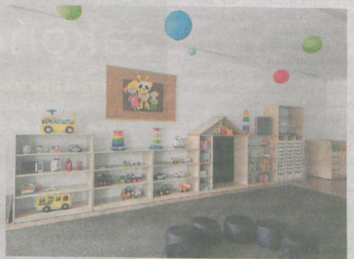
Żłobek w Kotlinie czeka już na maluchów