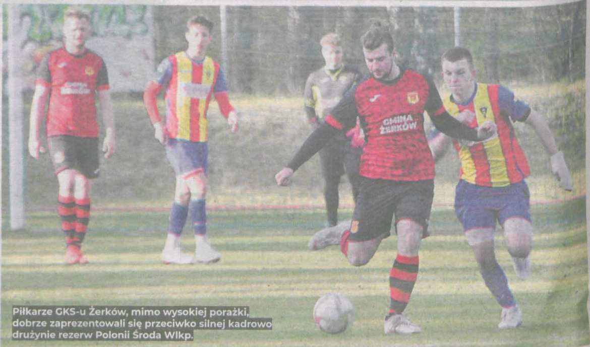
Piłkarze GKS-u Żerków, mimo wysokiej porażki, dobrze zaprezentowali się przeciwko silnej kadrowo drużynie rezerw Polonii Środa Wlkp.