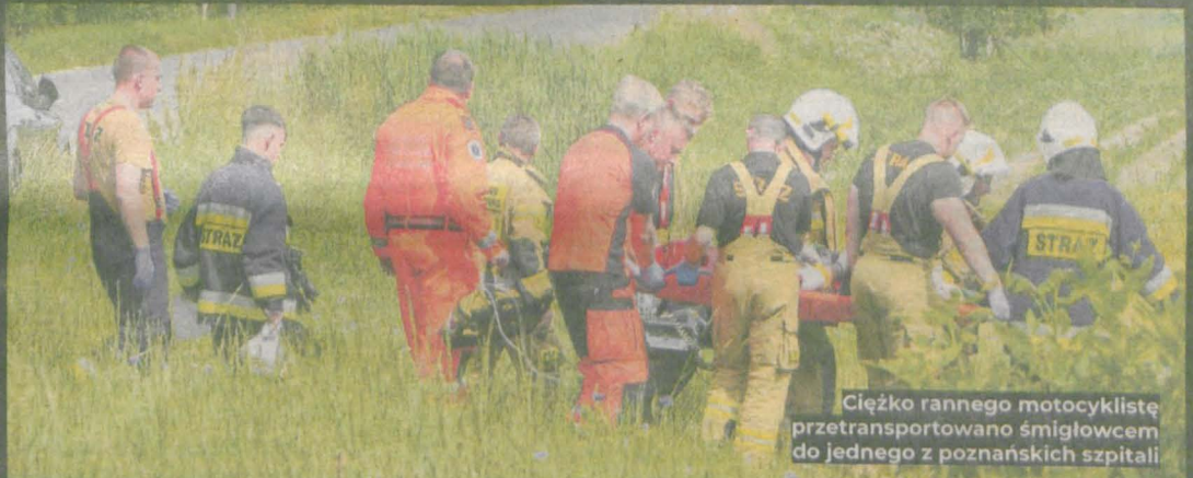
Ciężko rannego motocyklistę przetransportowano śmigłowcem do jednego z poznańskich szpitali

Cztery osoby ucierpiały w dwóch groźnych wypadkach motocyklistów. - Wokół leżały połupane kości - opowiada świadek zdarzenia.