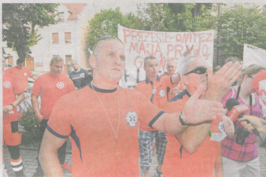
Prawie 5 lat temu nasi ratownicy medyczni protestowali na ulicach Jarocina

ZWOLNIENIA OPIEKUNEK MEDYCZNYCH. PIELĘGNIARKI I RATOWNICY BEZ DODATKÓW. Co w tej sytuacji grozi pacjentom jarocińskiego szpitala?