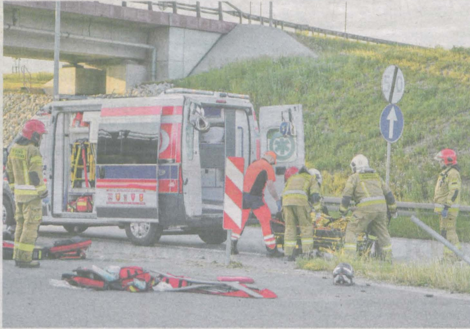
Dwie osoby ucierpiały w niedzielnym wypadku na obwodnicy Jarocina

Policja nie przesądza, kto jest sprawcą zdarzenia. – Na drodze ze Śmiełowa do Komorza doszło do zderzenia czołowego dwóch motocykli. W zdarzeniu udział brali 37-letni mieszkaniec gminy Września, kierujący motocyklem yamaha oraz 22-letni mieszkaniec gminy Jarocin, który poruszał się motocyklem kawaski. 37-latek został przetransportowany helikopterem do szpitala w Poznaniu, na-