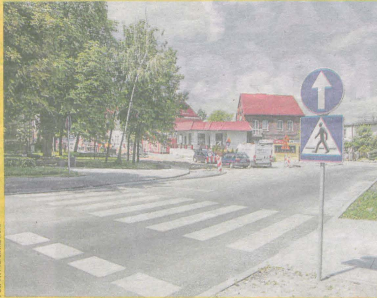
Nowe ulice w centrum Jarocina czekają na oznakowanie

Tak jest na przykład na ulicy Śródmiejskiej, która jest teraz o wiele węższa niż przed przebudową. – Nie wiadomo, czy ona jest jednokierunkowa, czy nie. Wjechałem ostatnio i zaparkowałem na parkingu naprzeciw szpitala. Załatwiłem swoją sprawę i nie wiedziałem, czy mogę wyjechać tak, jak wjechałem, czy mam objeżdżać pół miasta, bo ulica jest jednokierunkowa – opisuje jeden z mieszkańców