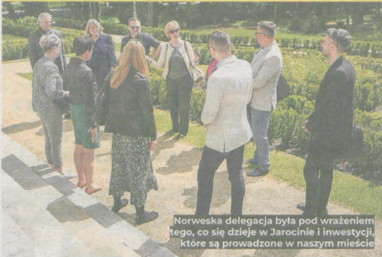
Norweska delegacja była pod wrażeniem tego, co się dzieje w Jarocinie i inwestycji, które są prowadzone w naszym mieście