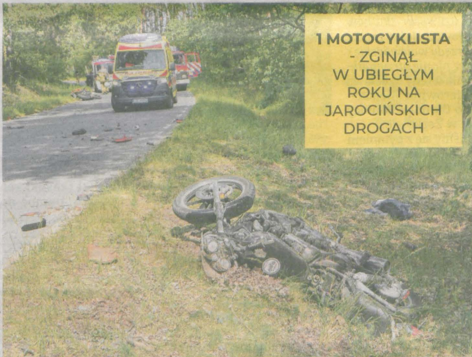
Na łuku drogi Śmiełów - Komorze Przybysławskie zderzyło się dwóch motocyklistów

27-latek z rozległymi obrażeniami w szpitalu Kilkanaście godzin później – w niedzielę – na obwodnicy Jarocina doszło do kolejnego wypadku z udziałem motocyklisty. – Na drodze S11 – od strony Jarocina – kierujący motocyklem Suzuki