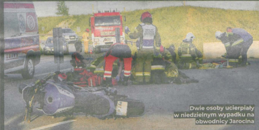
Dwie osoby ucierpiały w niedzielnym wypadku na obwodnicy Jarocina