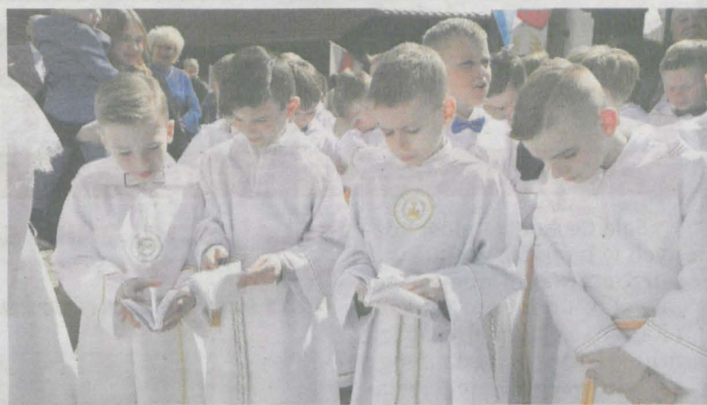
Czas oczekiwania na rozpoczęcie Eucharystii