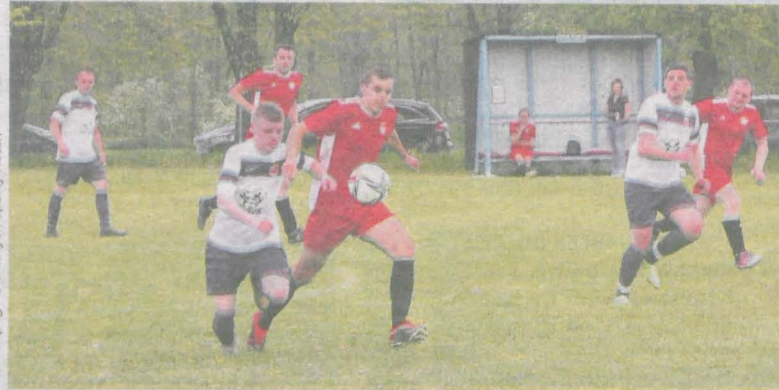
Mecz Błękitnych Sparty Kotlin z Piątę II Kobylin był ostatnim rozegranym na boisku w Magnuszewicach przed renowacją obiektu