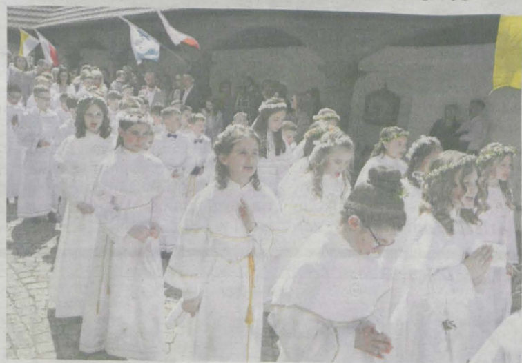
Do sakramentu przystąpiło 86 dzieci w dwóch grupach