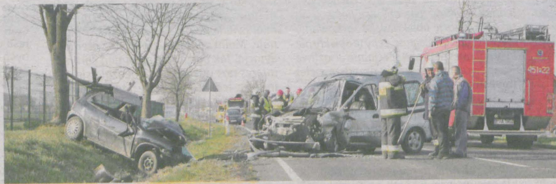
Kierująca renault kangoo kichnęła i straciła panowanie nad pojazdem. Najpierw zjechała na pobocze, a wracając na swój pas, przejechała na przeciwną stronę jezdni i uderzyła w oplem corsa. Jego kierowcy nie udało się uratować