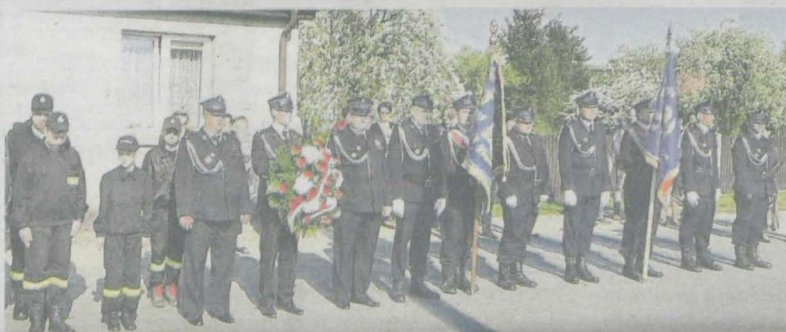
Św. Floriana obchodzone również w Dobieszczyźnie