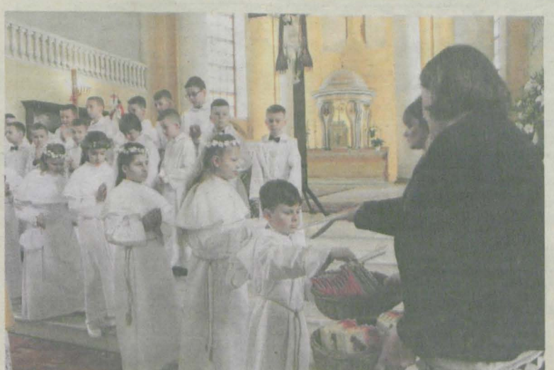
W parafii Chrystusa Króla w niedzielę 8 maja do I Komunii Świętej przystąpiło 43 dzieci. Każde otrzymało chleb, którym podzieliło się z gośćmi oraz obrazek z aniołkiem i czekoladę - prezent od dekoratorki kościoła.