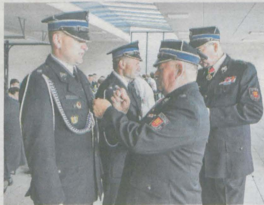
Najbardziej zasłużeni z gminy Jaraczewo otrzymali medale