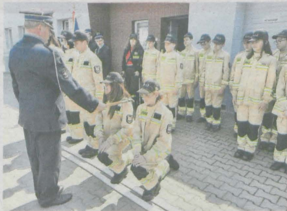
Nowi członkowie DDP i MDP złożyli ślubowanie i zostali pasowani na strażaków OSP Golina