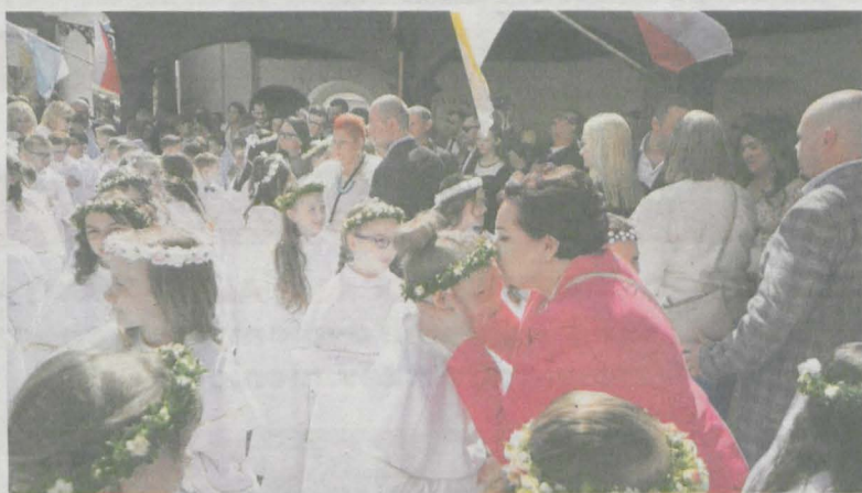
Błogosławieństwo udzielane przez rodziców