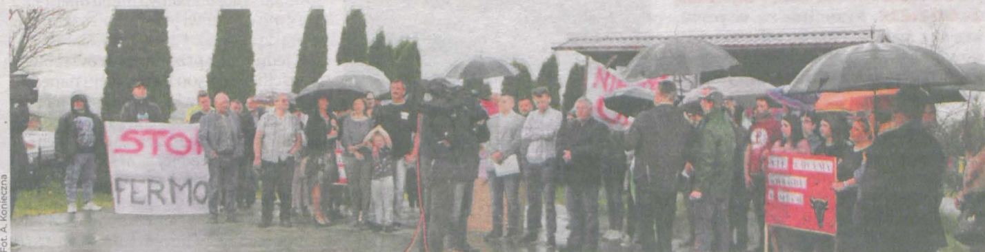
Mieszkańcy, mimo ulewnie padającego deszczu, stali na placu, żeby móc się wypowiedzieć w reportażu telewizyjnym