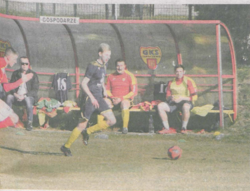
razie wiosną na własnym boisku. W meczu z Sokół Chwałkowo stracili

rawie zaprezentujemy się lepiej - podsumował spotkanie trener Cielczan Łukasz Kaczała.