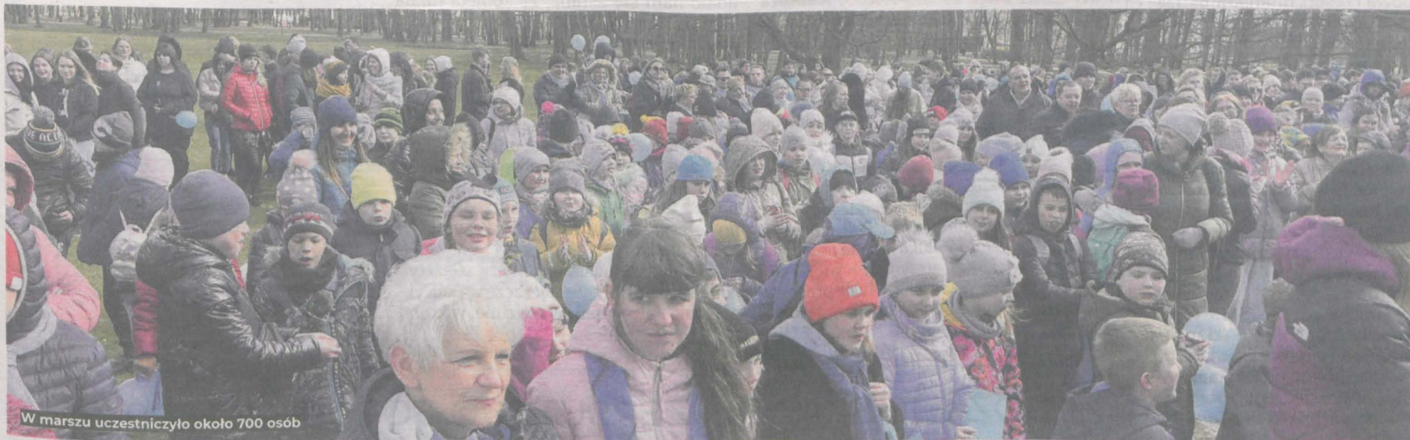
W marszu uczestniczyło około 700 osób