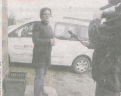
fol. Archiwum CJ