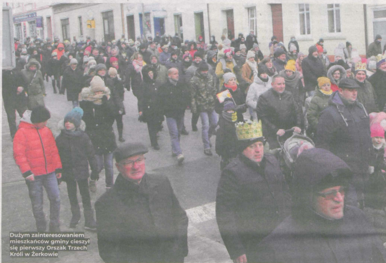
Dużym zainteresowaniem mieszkańców gminy cieszył się pierwszy Orszak Trzech Króli w Żerkowie