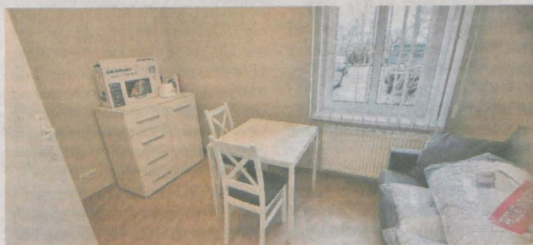
Ze względu na krótki czas działania dom w Dobieszczyźnie na razie czeka na pierwsze skierowane tam osoby