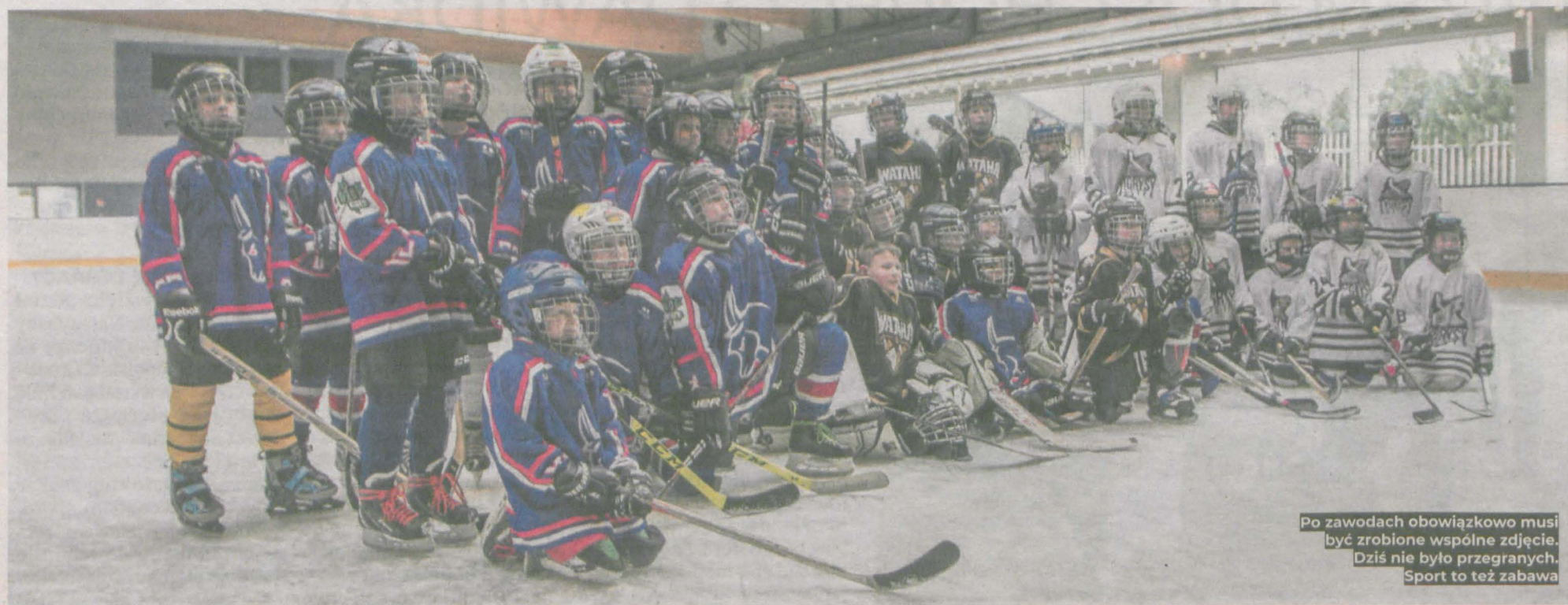
Po zawodach obowiązkowo musi być zrobione wspólne zdjęcie. Dziś nie było przegranych. Sport to też zabawa