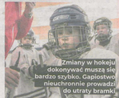
Zmiany w hokeju dokonywać muszą się bardzo szybko. Gapiostwo nieuchronnie prowadzi do utraty bramki

uzyskać m.in. informacje na temat treningów hokeja na lodzie dla najmłodszych. Wstępnie zainteresowanie treningami w sekcji minihokeja wyraziło kilkanaście osób. Zajęcia popołudniowe powinny ruszyć jeszcze przed feriami. Mają być kontynuowane do zakończenia sezonu. - Wszystkie zawodniczki i zawodnicy z tych zaprzyjaźnionych klubów wyjeżdżali bardzo zadowoleni z turnieju i odwiedzin w Jarocinie, obiecując wrócić tu jeszcze tej zimy - dodaje Kapustka. (red.)