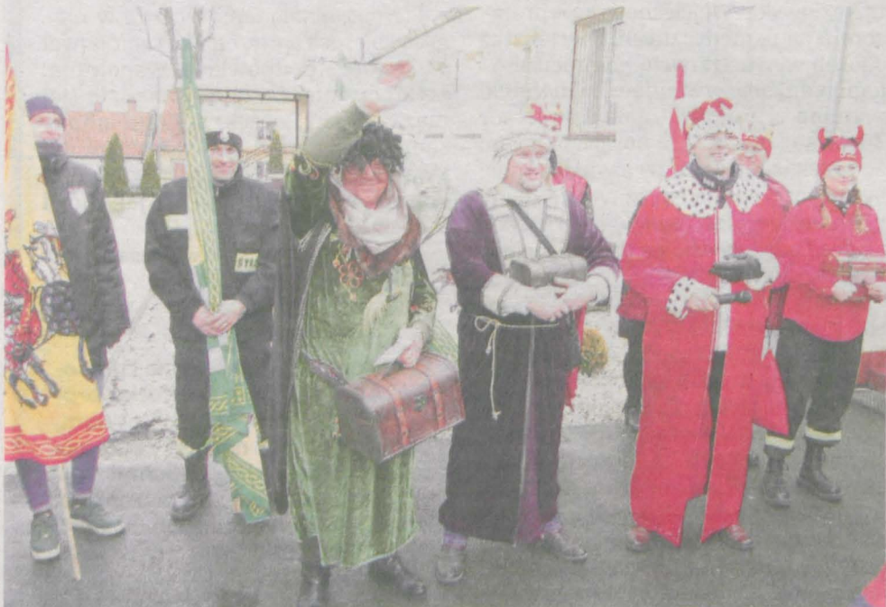
Orszak Trzech Króli przeszedł ulicami Cielczy