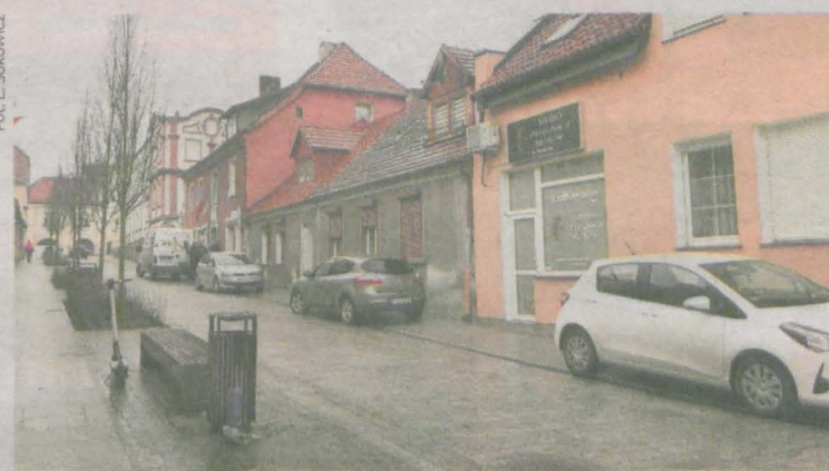
Tak obecnie wygląda deptak na ul. św. Ducha w Jarocinie