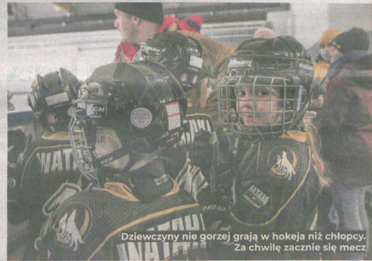
Dziewczyny nie gorzej grają w hokeja niż chłopcy. Za chwilę zacznie się mecz