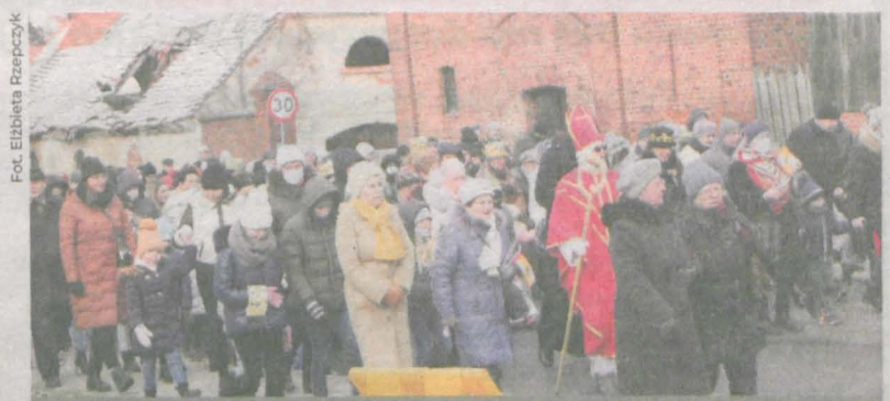
Fot. Elżbieta Rzepczyk

Nr 2 (1630) 11 stycznia 2022 | ISSN 1230-851X | Nr indeksu 34382X | cena 3,50 zł (w tym 5% VAT)