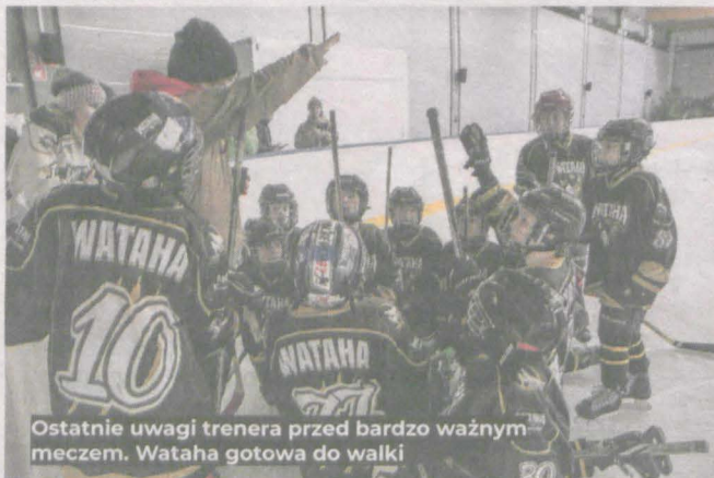
Ostatnie uwagi trenera przed bardzo ważnym meczem. Wataha gotowa do walki