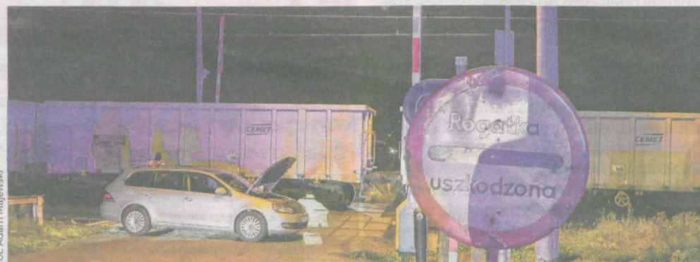
Ostatecznie policja ukarała kierującą autem mandatem za spowodowanie kolizji na przejeździe kolejowym

Zdarzenie wywołało sporo kontrowersji i dyskusji w sieci. Tym bardziej że do kolizji doszło na przejeździe, na którym kierowcy sygnalizowali problem z zaporami. Jednego razu, jak relacjonowali zmotoryzowani, rogatki podniosły się w czasie jazdy pociągu. Innym razem automat uniósł je w górę, a wtedy nadjechał skład. Co warte podkreślenia, kraksa wydarzyła się, kiedy przed przejazdem kolejowym był umieszczony znak B32 - uszkodzone rogatki. Została stwierdzona usterka podglądu na przejazd. Kolej