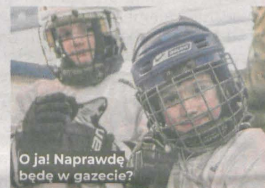
O ja! Naprawdę będę w gazecie?