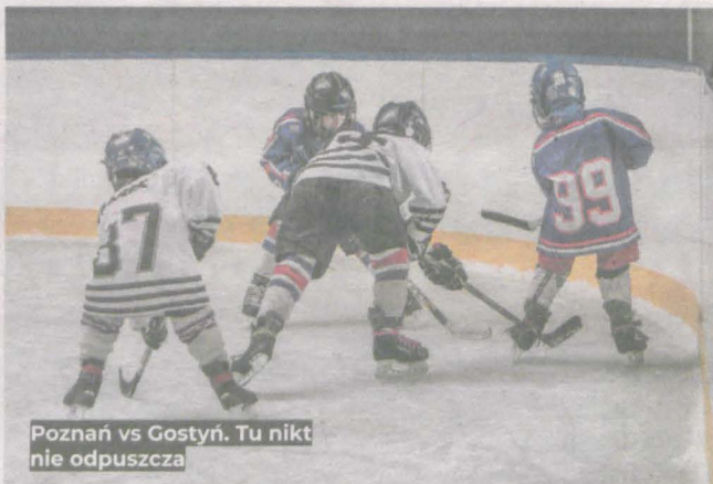
Poznań vs Gostyń. Tu nikt nie odpuszcza