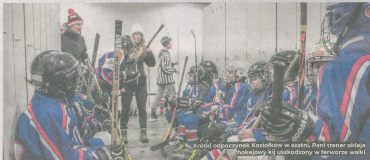
Krótki odpoczynek Koziołków w szatni. Pani trener okleja hokejowy kij uszkodzony w ferworze walki