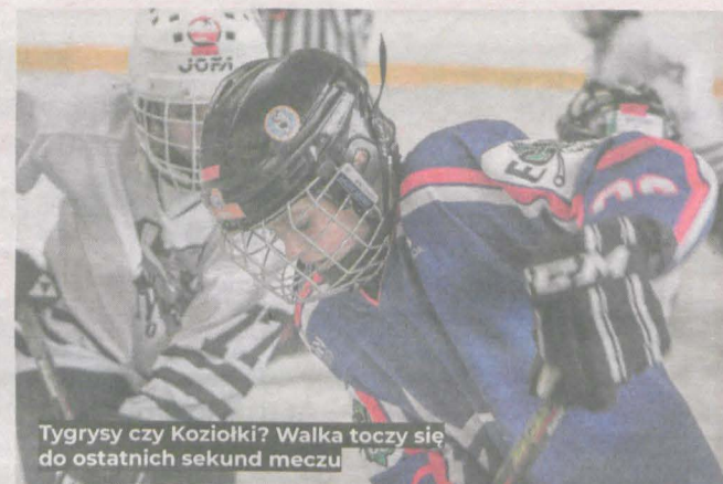
Tygrysy czy Koziołki? Walka toczy się do ostatnich sekund meczu