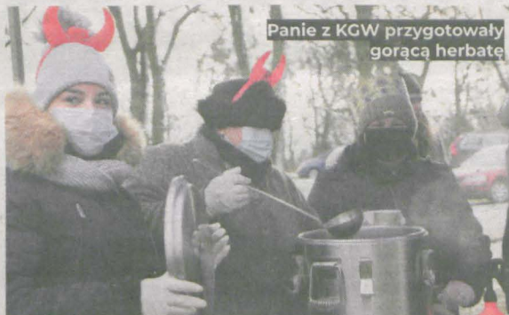
Panie z KGW przygotowały gorącą herbatę