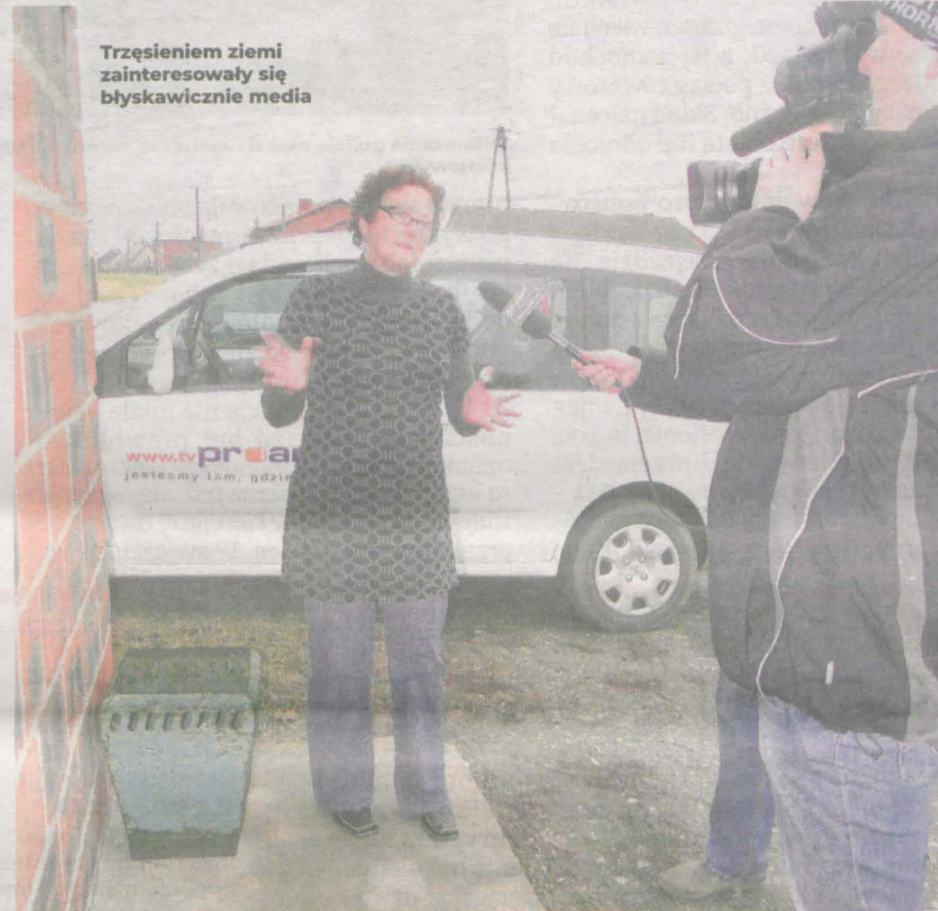
Trzęsieniem ziemi zainteresowały się błyskawicznie media

DEKADĘ TEMU ZATRZĘŚLA SIĘ ZIEMIA W POWIECIE JAROCIŃSKIM. NAJSILNIEJSZE WSTRZĄSY WYSTĄPIŁY NA TERENIE GMINY ŻERKÓW. - Nagle pokój zaczął wirować, kanapa się ruszała. Trwało to ułamek sekundy - przypomina sobie dzień sprzed 10 lat osoba dotknięta kataklizmem.