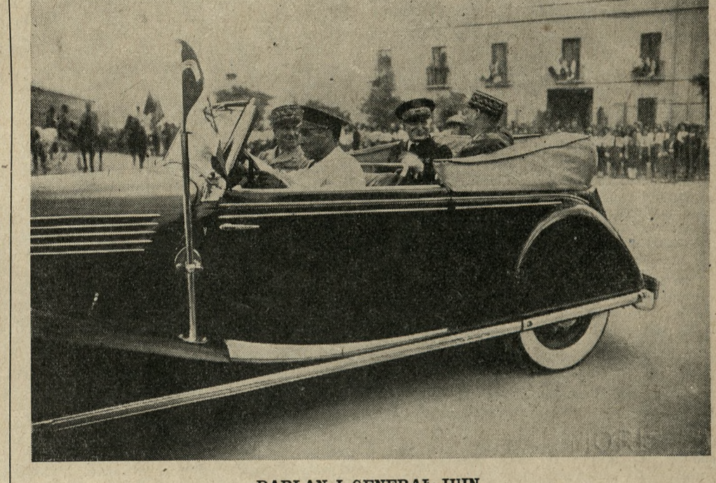
DARLAN I GENERAL JUN

enie Lavalą z rządu odbije się na stosunkach francusko-niemieckich w sposób decydujący. W Vichy po zamykaniu napięcia było ogromne, gdyż nie było wiadomo, jaka będzie reakcja Hitlera, czy trzeba będzie niecałkowicie odstąpić od niemieckiego obozu koncentracyjnego, czy utrzymać Lavalą w rękach. Zaczęła się już panika. Dopiero światełko nadziei zgasło z Hitlerem w okresie świąt Bożego Narodzenia sytuacja się wyjaśniła. Kryzys zakończył się dymisją dwóch