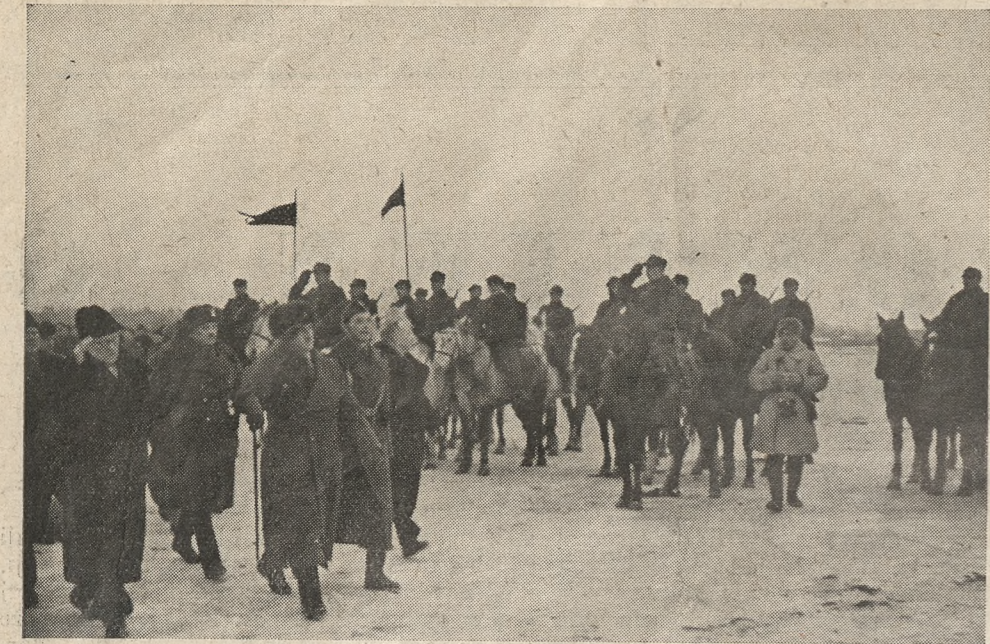
GENERAL SIKORSKI WŚRÓD FORMUJĄCEJ SIĘ ARMII

Gdy Cripps udaje się do teatru, agenci jada za nim samochodem. Jeden stoi z zewnątrz, drugi w hallu, trzeci towarzyszy mu w teatrze. Gdy tylko ambasador zajmuje swe miejsce, agent udaje się ku krzesłu bezopisowego za ambasadorem i o ile miejsce to nie jest zajęte przez Europejczyka, trąca widza w ramię, pokazuje mu swój znak i zasiada na miejscu które ów widz musi opróżnić. Nigdy nie mogłem się dowiedzieć, czy nieszczęśliwa osoba, wyrzuciona ze swego miejsca, otrzymuje przynajmniej zwrot ceny biletu.