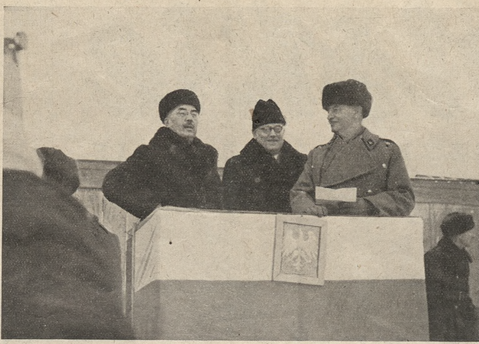
DEFILADA W OBOZIE: NA TRYBUNIE AMBASADOR KOT, PRZEDSTAWICIEL RZĄDU SOWIECKIEGO WYSZYŃSKI I GENERAL SIKORSKI

tarze miejscowi, szef protokołu z Kujbyszewa i ośmiu specjalnych agentów N.K.W.D. (obecna nazwa G.P.U.), którzy zostali przysiani z Moskwy i przydzieleni do Sikorskiego na czas jego pobytu w Rosji. Naogół byli to ludzie bardzo przyjemni; rozkoszowali się dobrą kuchnią, którą wszędzie nam zapewniano. Cała kolumna samochodów zawiozła nas do miasta, gdzie umieszczono nas w najlepszym hotelu „Intourista” w całej Rosji. Hotel ten by