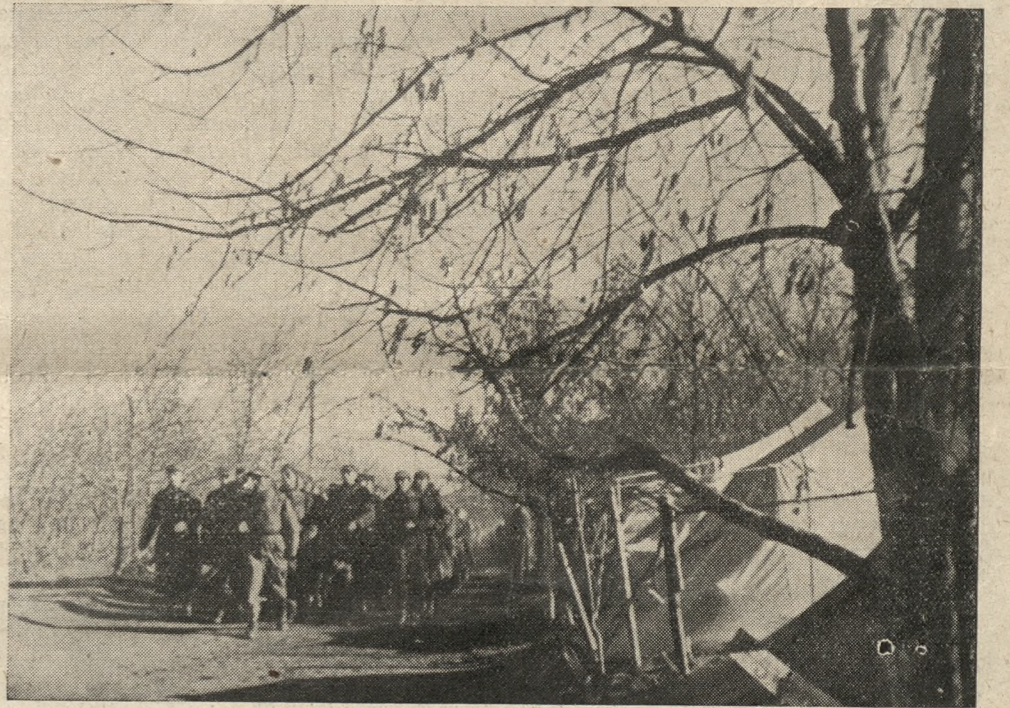
OBOZ W TOCKOJE

Dzieci wyglądały zdrowe i szczęśliwe, żywoowały i saneczowały się po ulicach bez względu na pogodę. Młodzież w teatrach robiła wrażenie rozradowanej, a zakochane pary zachowywały się jak zakochane pary na całym świecie. Kobiety były nędznie ubrane, lecz miały włosy i ręce dobrze utrzymane. Tu wtrącaę dmiwającą historyjkę. Obok Grand Hotelu znajdował