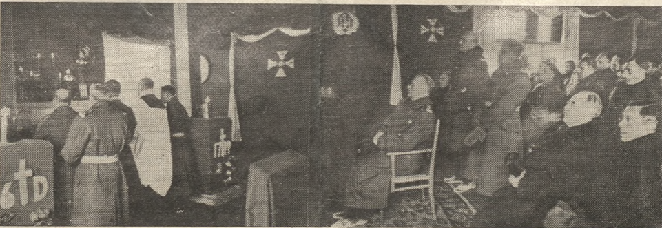
MSZA W KAPLICY W TOCKOJE DN. 12 GRUDNIA 1941 R. ZA GEN. SIKORSKIM STOJĄ GEN. ANDERS I GEN. TOKARZEWSKI-KARASIEWICZ, W GŁĘBI SIEDZI PRZEDSTAWICIEL RZĄDU SOWIECKIEGO WYSZYŃSKI, Z PRAWEJ AMBASADOR KOT I JÓZEF RETINGER