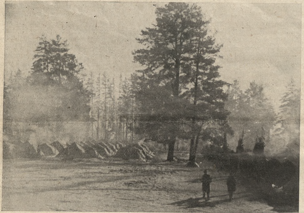
OBOZ W KOETUBANCE

dotąd nie wytłumaczył, jak moglibyśmy wygrać wojnę, gdyby Niemcy nie zaatakowali Rosji.