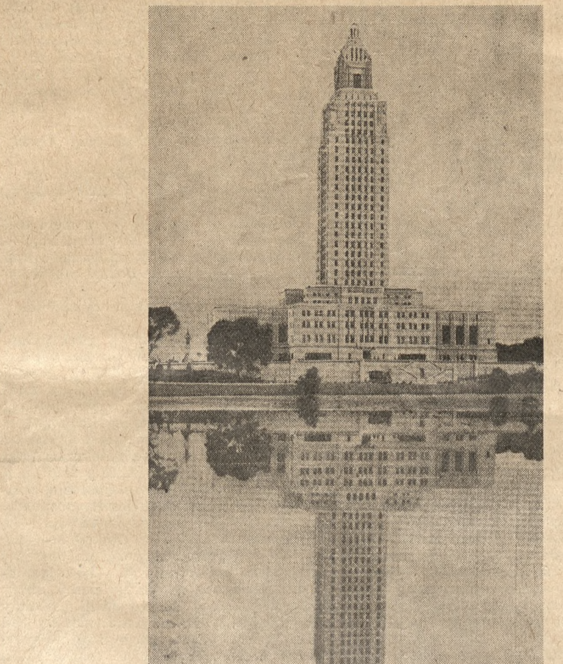
NOWY KAPITOL W BATON ROUGE

Wzdłuż nadbrzeży przejeżdżamy obok dużego szeregu magazynów, z których cały świat zaopatrywany jest w bawełnę. Stąd wychodzą — i znów wychodzić będą — statki bezpośrednio do Gdyni z ładunkami dla Łodzi, omijając tradycyjny rynek bawełniany w Bremie. Dalej składy kawy, bana-