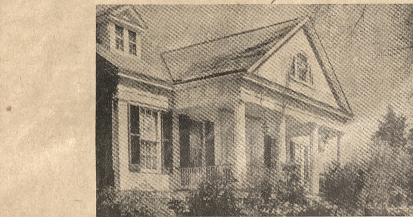
DOM Z ROKU 1832 W THE BURN

Był to jednak dziwny okres, w którym wskazówka na zegarze dziejów posuwała się z podobną szybkością, jak obecnie. Dziwną musiał mieć minę gen. Victor, gdy w 20 dni po jego proklamacji nadeszła wiadomość, że Napoleon odstąpił cały ten kraj Stanom Zjednoczonym za 15 milionów dolarów.