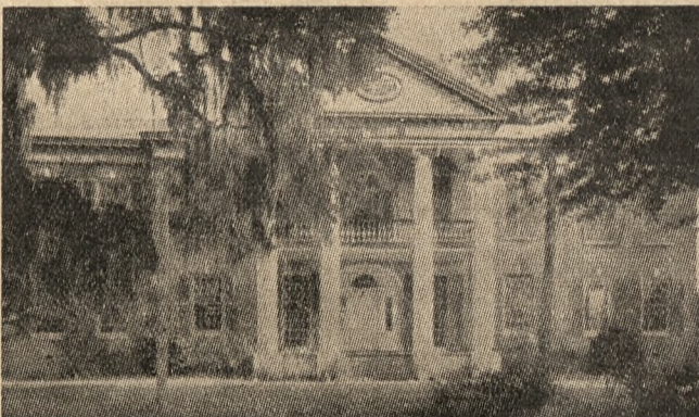
DOM Z ROKU 1816 W AUBURN

Dawny „Place d'Armes“ już nie istnieje. W kilkanaście lat po usunięciu władzy fran-