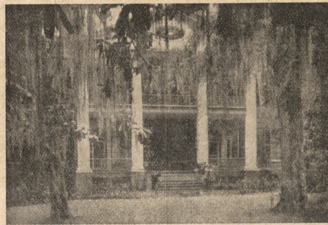
DOM Z ROKU 1803 W GLOUCESTER

Ale wszystko to, w tym tak szczęśliwym kraju, „przemiętło z wiatrem“. Następnego dnia jesteśmy na polu bitwy pod Vicksburg, gdzie zwycięskie wojska północne zdecydowały o losach stanów skonfederowanych. Wznieśli tu pomnik na cześć obu walczących, a później pojednanych stron: „Tu bracia walczyli o zasady. Tu bohaterowie