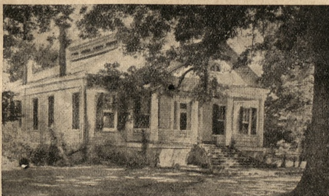
DOM Z ROKU 1853 W LANDSDOWNE