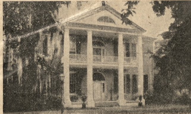
DOM Z ROKU 1816 W ARLINGTON

Od tych wspomnień historycznych wracamy do teraźniejszości, gdy samochodem przecinamy bogate rolnicze stany Mississippi i Alabama. Pola trzciny cukrowej i bawełny, bawełny i trzciny cukrowej, rzadko ustępujące polom jarzyn, truskawek, drzew owocnych lub młodym lasom. Dziwne, że w miłym kraju nawet lasy są takie. Co kilkanaście mil, pod nędznym dachem, warsztaty fabryczne do wytopienia słodkiej cieczy z trzciny lub odłączania z tego włókna od oleistego ziarna bawełny. Rzadko rosnące osady i miasteczka robią przywrażliwe wrażenie. Szalasy i budy takie, jakie