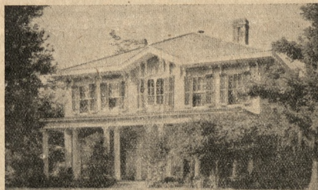
DOM Z ROKU 1850 W EDGEWOOD

W miarę zbliżania się do zatoki meksykań-