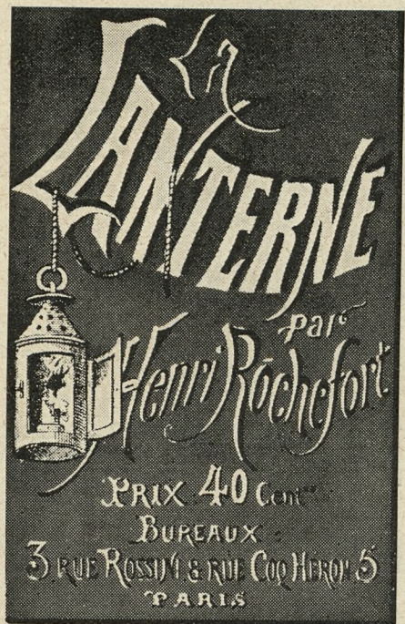
OKŁADKA „LA LANTERNE”