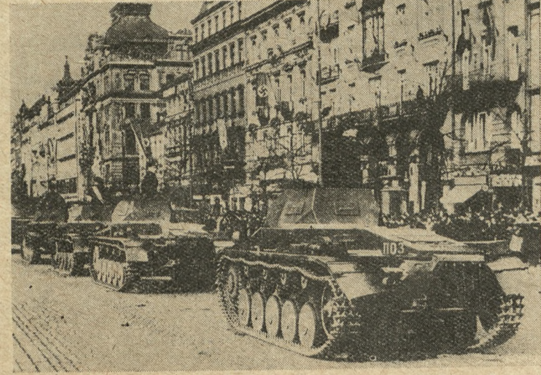
CZOŁGI NIEMIECKIE NA VAČLAVSKEM NÁMĚSTÍ

Przed wejściem do hotelu stało już dwóch motocyklistów z krótkimi karabinkami w ręce; w hallu przy wejściu dwóch młodych ludzi z odznakami swastyki w kłapach