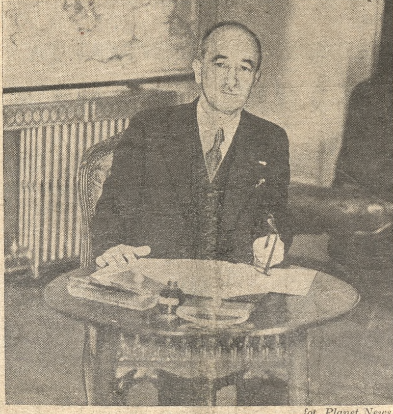
PREZYDENT EDUARD BENEŠ