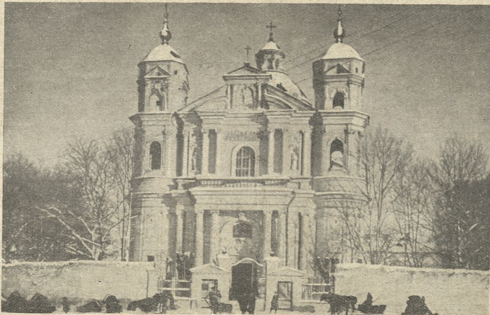
KOŚCIÓŁ ŚW. PIOTRA NA ANTOKOLU

Rossa jest dostojna i ogromna i ma dużo pomników bardzo udanych, ale cmentarz bernardyński położony na zboczach góry, z wstęgą Wilenki pod nogami,