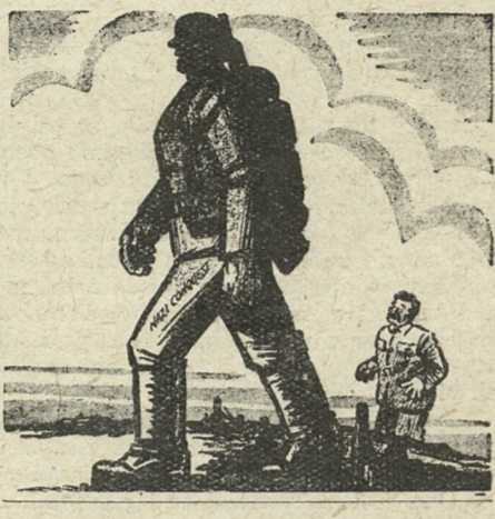
„Cavaleade” FRANKENSTEIN STALINA