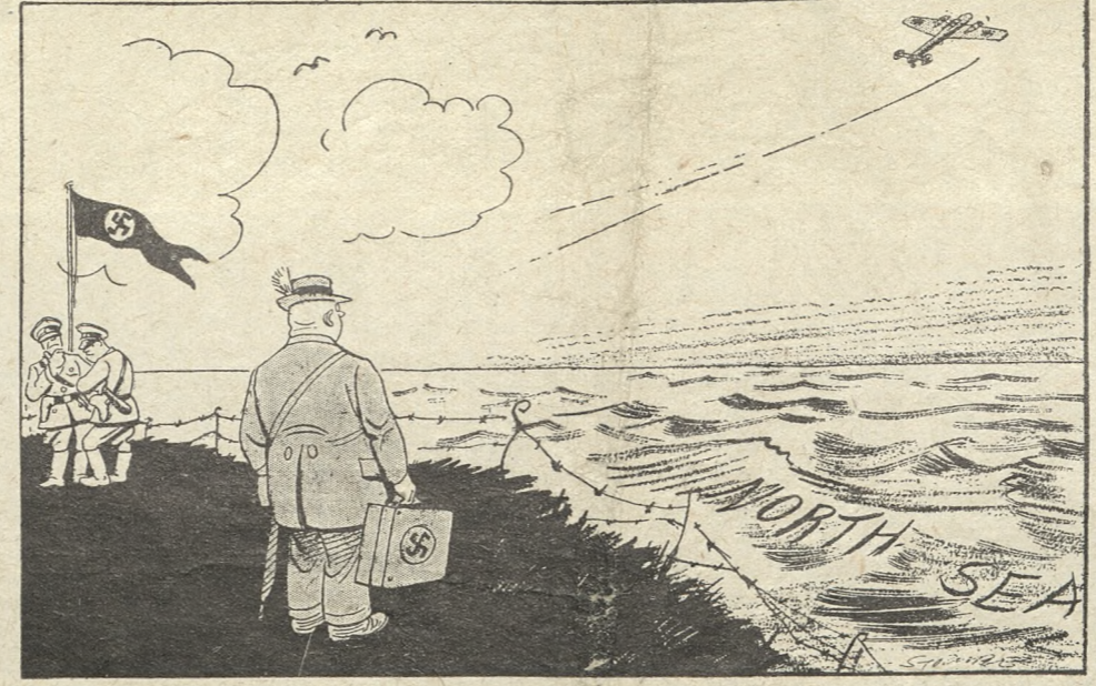
— Gdybym miał skrzydła... („Daily Express”)

Rodzina K. pochodzi niewątpliwie z Niemiec. Dziadek rannego podporucznika bodaj słabo mówił po polsku. Wnuk mówił słabo po niemiecku. Do podporucznika K. zwrócił się władze niemieckie z propozycją którą można streścić jak następuje: „Pochodzi pan z rodziny niemieckiej, ale wiemy, że czuje się pan Polakiem. Mimo to niech pan wraca do swojej fabryki, nie więcej od pana nie będziemy wymagałi jak tylko dalszej pracy na swoim stanowisku. Podpisze pan dla formalności oświadczenie, że czuje się pan „Volkdeutschem”, ale to do nieczego pana nie zobowiązuje. Nie będzie się pan potrzebował ani angażować, ani wyciągać żadnych innych konsekwencji z tego oświadczenia...”