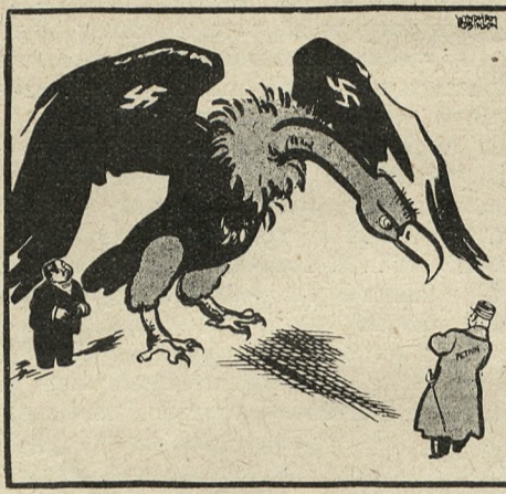
SEK BRONI SWEGO PISKLECIA