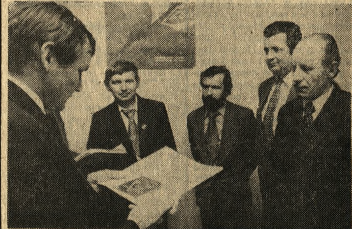
Na zdjęciu: „Dom z jedyńką” odbierają przedstawiciele załogi Przedsiębiorstwa Budownictwa Rolniczego w Wyrzysku (woj. pilskie).

W województwie leszczyńskim: Leszno — Osiedle Estkowskiego II, budynek 25, wy-