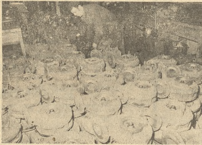
Leszczyńska Fabryka Pomp wytwarza różne ich rodzaje. Służą albo do pompowania wody albo paliwa. Odbiorcami są liczne zakłady w kraju (m. in. „Cegielski”) i za granicą.